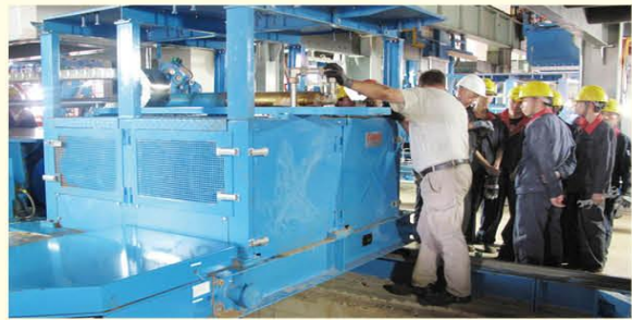
9月29日，源鑫公司600kt/a炭素项目成型配料混捏系统成功联动带料试车。系统的成功运行，助推源鑫公司向产出成型炭块的目标又跨出了一大步，为成型系统的全线贯通、实现其所有设备联动试车扣上了坚实的一环。（罗永鹏）

强，有色金属个股再次成为市场关注的焦点。据报道，37家有色金属公司已公布三季度业绩预告，预告显示，6家公司预增，4家预盈，预降、预亏公司分别为15家、7家。业绩向好公司已公布业绩预告公司比不到三成。