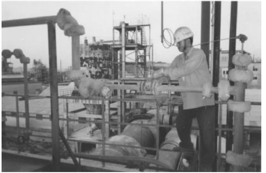
氟化盐厂制酸6号电磁流量计在送到岳阳无法校验的情况下,该厂仪表班职工通过自己反复调试,终于在7月28日点火复产前校正完毕,确保了复产的正常进行。图为仪表工校验场景。

与乡下相比,社区的邻里更为密集,虽说不必为一块宅地闹出纠纷来,但一些小事也足以让其邻里关系紧张,如过道上走廊里乱丢垃圾,乱堆杂物,深夜音响开得特别大,影响邻里睡眠,打牌撮麻将通宵达旦、大声喧哗,不顾邻里反对等等不良现象偶有发生,这些都可以影响我们邻里关系。我曾见一人在过道上因踩一块西瓜皮被滑倒的整个经过,这人爬起来后第一件事便是找他的邻居论理,双方的嗓门越来越高,大有动武之势,我忙劝