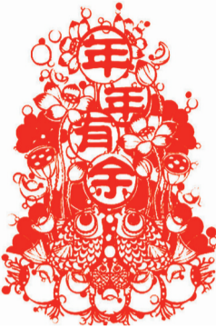
年年有余 白素菊 作

打开邮箱，一眼就看到了这几个字：奔向美好。它们虽然是系统自动推送的，但给人的喜悦就像是收到礼物一样。新的一年了，就当是一份新年礼物吧。这样想着的时候，转头看了下窗外，很冷，风呼呼吹着，但天很好，阳光很明亮，心里暖暖的。