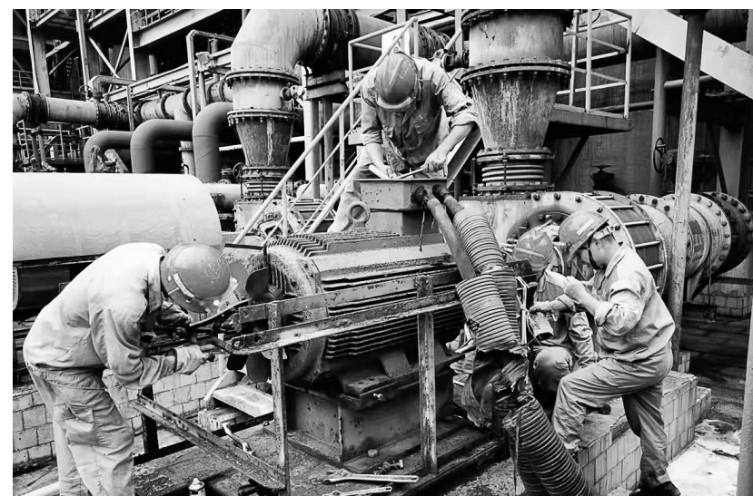
8月20日上午,工程技术分公司金冠项目部电仪班对金冠铜业分公司双闪厂区硫酸车间的一级动力波区域A泵280千瓦电机轴承进行更换。图为电仪班检修人员齐动手、同上阵,顶着烈日的“炙烤”,历时四个小时圆满完成此次检修任务,有力保障了业主单位正常生产。