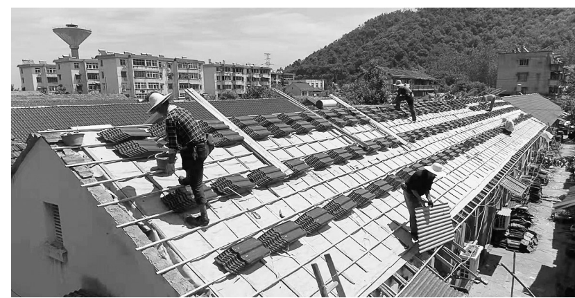
8月19日,铜山铜矿分公司职工家属区老旧房屋修缮工程现场,工人正在更换面瓦。据了解,该公司职工家属区民房普遍建造于上世纪七八十年代,设施老化。为改善、提高职工居住条件,该公司对矿区内中心区域权属房进行集中修缮,改造后的职工家属区,环境、设施将得到改善。