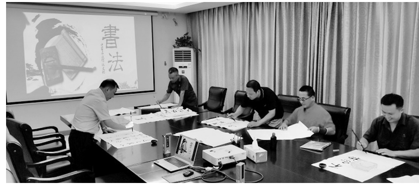
日前,张家港铜业公司举办职工毛笔书法比赛。该公司为丰富职工业余文化生活,营造积极向上、健康文明的文化氛围,开展形式多样的文娱活动,陶冶职工情操。