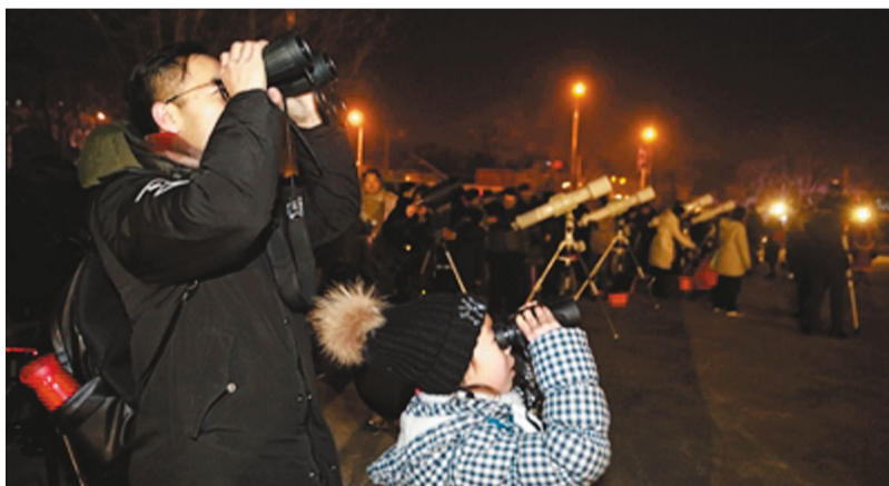
1月31日,北京天文馆广场,市民利用各种望远镜观看月亮。