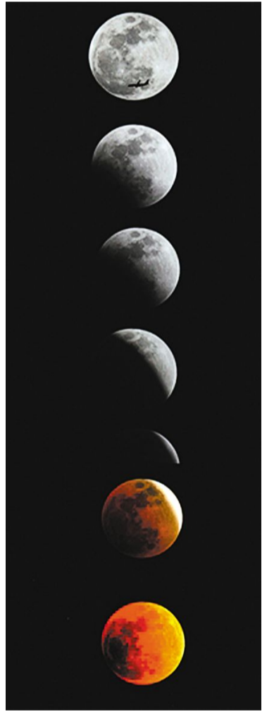
1月31日,北京市朝阳区,记者记录19:40至20:58的月食过程。(拼图)