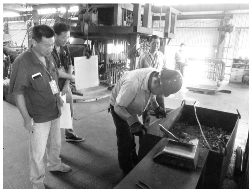
为全面提高熔铸工专业操作水平,9月9日,铜冠工公司在磷铜分厂举行熔铸工实践操作比武。此次熔铸工技术比武是在经过理论考试的基础上进行的实践操作比武,该公司将对在理论考试和实践操作比武中综合评分获得一、二、三名的选手将分别授予首席员工、技术能手等称号。