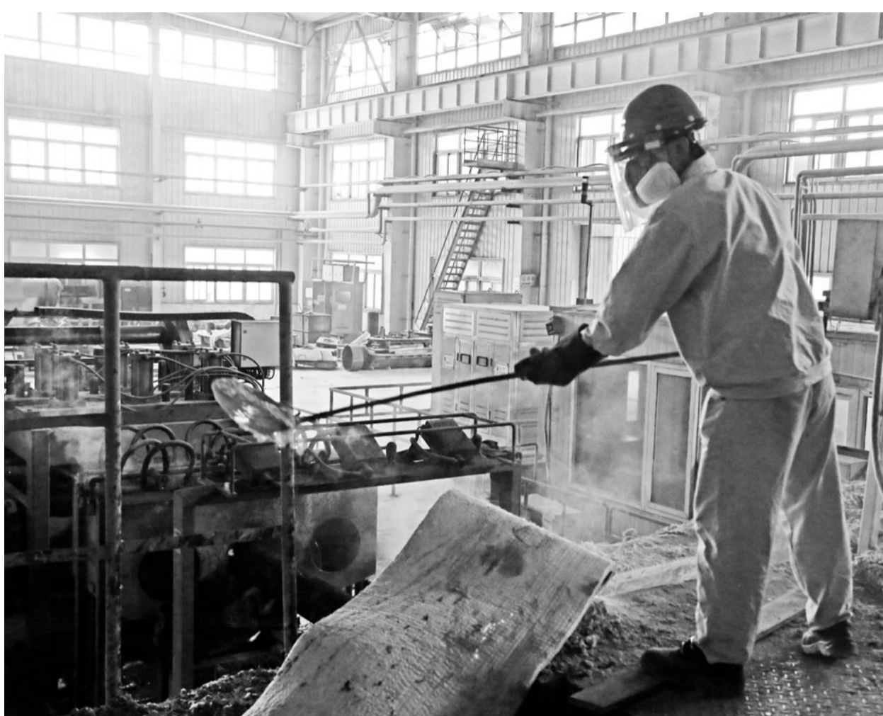
铜冠黄铜公司职工日前正在熔铸生产中进行捞渣作业。铜冠黄铜公司对熔铸生产中因使用废旧料造成油污中重杂质多,使得炉渣中金属含量高的弊端,为减少金属流失,积极采取加金属熔炼除渣剂,改进生产工艺和操作等措施,有效提高了金属利用率,降低了原料损耗。这项改进也获得安徽省重大合理化建议和技术改进成果项目奖。

因此,阿里巴巴参与打造“线上亚欧博览会”推介新疆,或多或少给我们一点启示和教益,品牌只能代表过去,只有不断进取,才有更广阔的市场。 沈宏胜