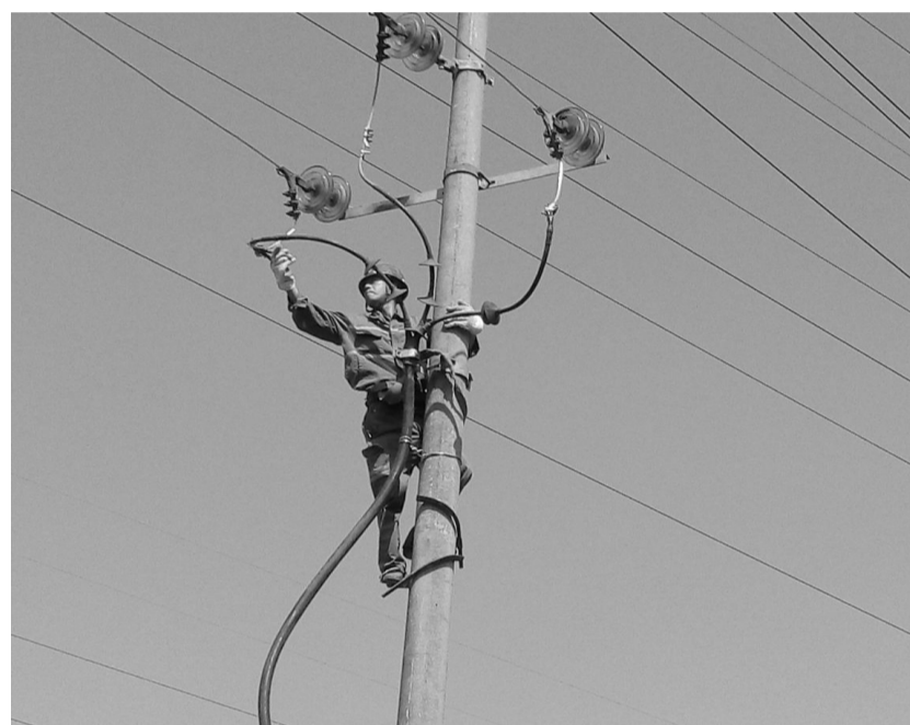
为保障矿山供电线路安全畅通,铜山矿业公司积极抓好供电线路的预防检查、抢修保障工作,实时掌握线路运行状况,对发现的隐患详细记录并及时处理,从源头上消除线路故障,确保矿山生产用电安全。 图为9月13日,该公司运转区电工正在对供电线路进行排查。

此次廉政谈话体现了该公司纪委“抓早抓小”、“关口前移”的工作思路,纪委专门下发实施方案,针对党风廉政建设的重点任务和存在的短板,明确了谈话重点、谈话程序、谈话人,完成谈话时间等。同时,该公司纪委还组织重点岗位干部进行个别廉政谈话。 杨学文