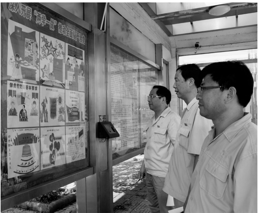
近日,铜冠冶化分公司举办“两学一做”学习教育专题宣传栏比赛,图为相关部门负责人正在对宣传栏进行评比。在“两学一做”学习教育中,该公司注意加强正面宣传和舆论引导,充分运用各种媒体,深入宣传中央和省市委精神,将学习教育的目的、具体要求、学习内容等,用职工喜闻乐见的形式直观地表现出来,为“两学一做”学习教育营造良好氛围。