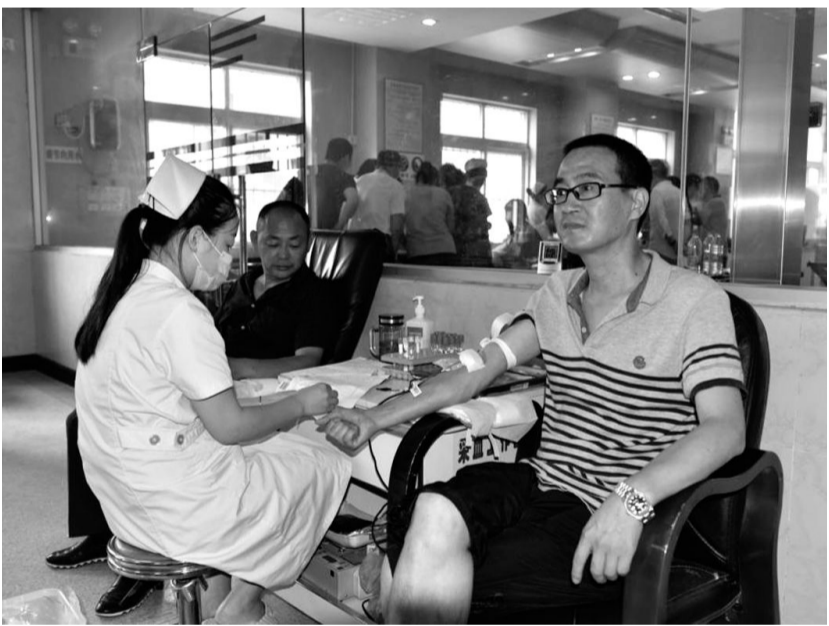
7月15日,凤凰山矿业公司组织60余名员工参加义务献血活动,共计献血量达11200毫升。到目前为止,该公司已连续开展义务献血17年,累计献血量达20多万毫升。