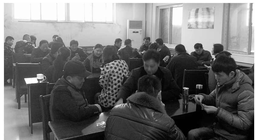
为丰富职工春节文化生活,日前,铜冠物流金运分公司组织开展了职工小桥牌比赛,来自分公司多个岗位员工约40人参加了比赛。图为比赛现场。