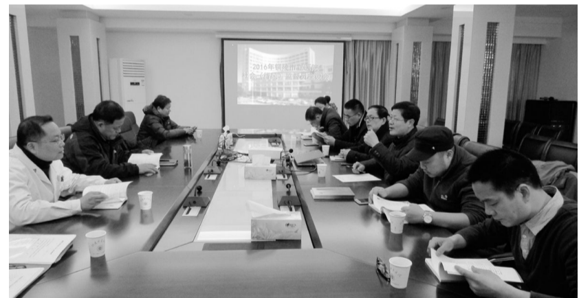
为加强对医务人员职业道德行为的约束和监督,提高廉洁行医、服务群众的道德意识,2月2日,铜陵市立医院召开社会监督员座谈会,广泛征求他们对该院医疗服务工作的意见。来自全市各界的10名行风监督员参加了会议,提出了意见和建议。图为座谈会现场。

‘对标挖潜’,尽力增收节支,全力开拓市场,注重产销结合,提高全员创新意识,增强自主创新能力,努力在成本控制、指标改善等方面精益求精。”该公司负责人提出了今年发展的方向。正如该公司负责人在新年致辞中说的一样,“有全体员工不畏艰难、顽强拼搏的精神,用我们的辛勤劳动和聪明才智,我们有理由相信新的一年再创新的辉煌和更加美好的未来!”“前路坎坷,有治化人的陪伴,我们无所畏惧。”主持人的串词道出了该公司全体员工的心声。在《明天会更好》的歌声中,晚会圆满落幕。傅大伟 钱庆国