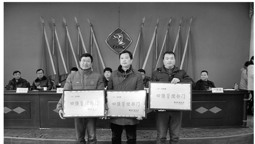
近日,铜山矿业公司召开2016年工作会议,鼓励先进,凝聚力量,对各类取得优异成绩的单位和个人进行表彰奖励。图为对获得“四强管理部门”的三个部门进行授牌表彰。