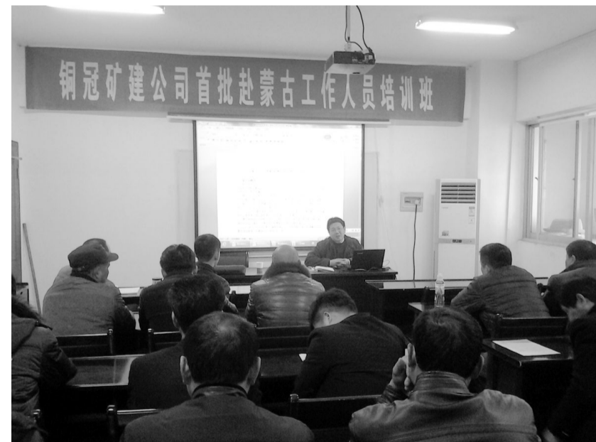
铜冠矿建公司于近期举办首批赴蒙古国工作人员出国前培训班。该公司新建的蒙古国乌兰矿采掘工程，是继赞比亚、津巴布韦、刚果(金)、土耳其后承建的第五个国家的工程项目。此次培训对象是首批赴蒙的20名员工，培训内容包括工程项目介绍、蒙古国的基本情况及注意事项等。