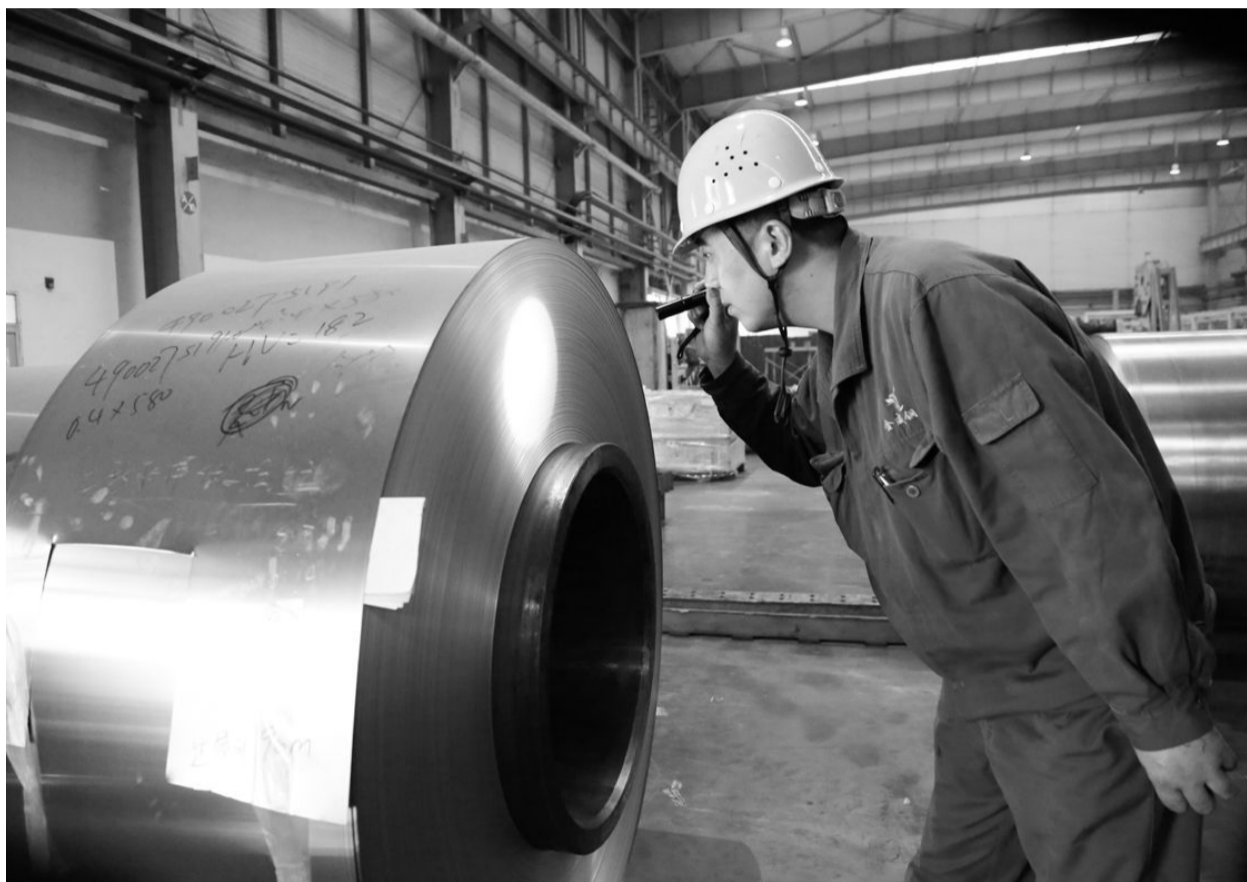
金威铜业公司职工日前正在巡查合金产品。金威铜业公司生产技术经过多年不断积累与研发，开发生产出以C194、C5191、C7541、C192为代表的高附加值合金产品，目前已基本突破了表面质量、性能指标等制约因素。特别是以C194为代表的高端合金产品实现批量生产，产品质量和档次处于市场领先水平。预计今年全年完成合金产量1600吨，同比增加51%。