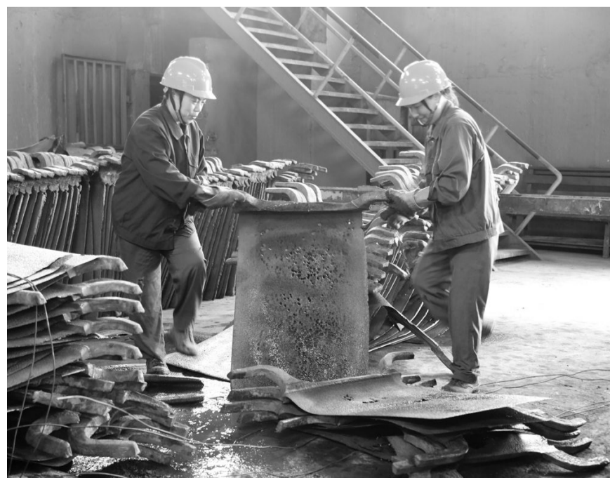
金昌冶炼厂职工目前正在整理回收阳极板电解后的残液。该厂近期进一步加大了挖潜降耗力度,通过精细化管理,在降低中间产品库存量和物资储备、减少财务费用占用的同时,进一步加强了电解中残液的回收利用,促进降本增效工作取得实效。