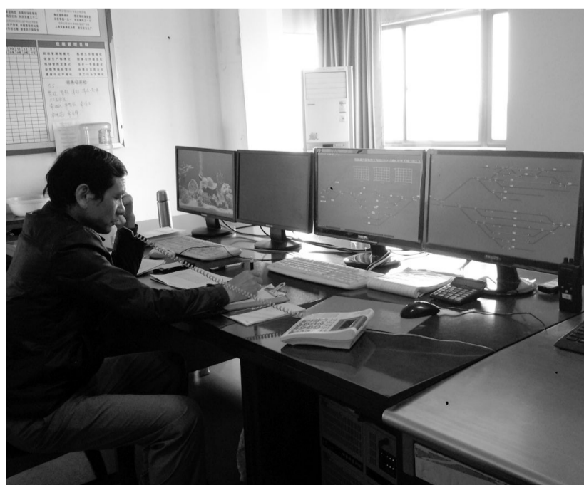
今年以来,铜冠物流北环公司强化管理,狠抓落实,确保年度目标完成。到10月底,该公司完成货运量157万吨,提前完成全年生产任务。图为铜新站调度员正在调度作业。

该公司还对合格承运商实行全过程管理和日常管控,并推行标准化作业,细化从承运商进入上游客户厂区、提货、发运、在途安全、货损界定到费用结算诸多环节。对违反《外协人员安全协议》以及上游客户现场管理制度、违规混装、擅自更改运行线路、发生货损货差而造成上游客户损失的承运商执行诫勉谈话制度和无条件赔偿制度;对屡次违反协议的承运商,将立即终止协议;对因违规造成客户财产重大损失的承运商,将诉诸法律。这些举措不仅保证了物流运输高效、可控和稳定,同时也为客户提供了高质量、高水平的物流服务。汪开松