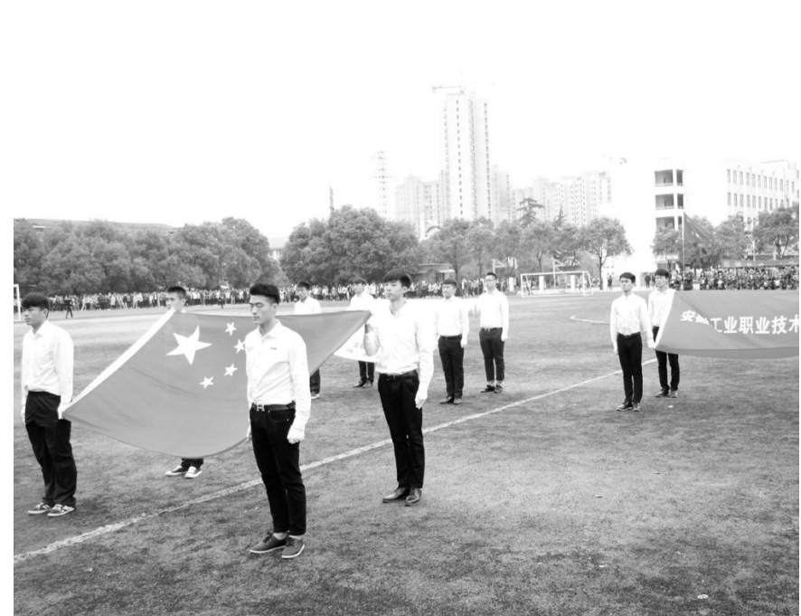
10月30日下午,安工学院第七届体育大会暨阳光体育运动会开幕式在该学院田径场举行。各系部队员们昂首阔步,神采飞扬,充分展示出大学生们意气风发、积极向上的精神风貌。