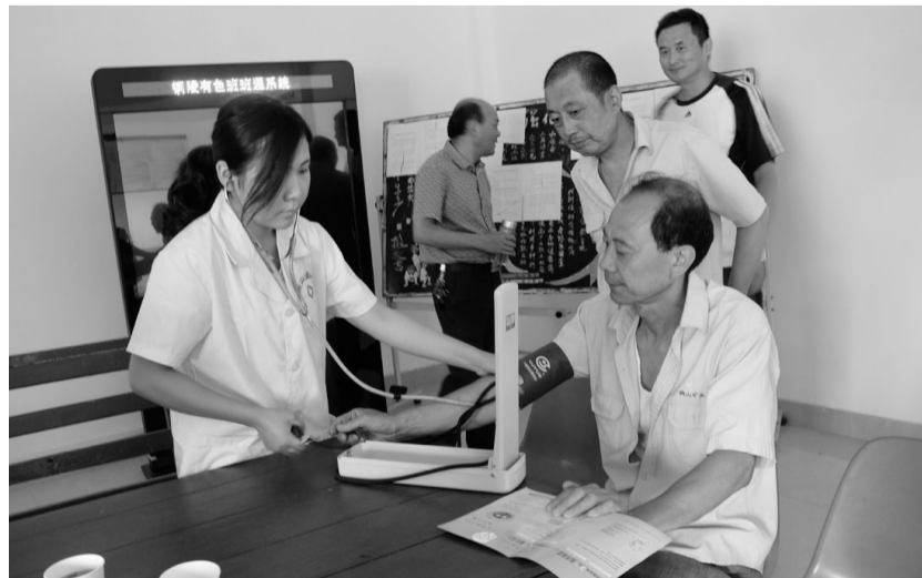
6月12日,铜陵市立医院医务人员为铜山矿业公司选矿车间员工做身体检查。近年来,该公司加大关爱职工力度,定期邀请医务人员为员工进行健康知识讲座、医疗咨询和职业健康检查,努力确保矿山员工身体健康。

与了新环保法的讲解、环保工程及环保设施等具体环保工作的PPT材料讲解活动。 当日,20名环保爱好者还对该公司的露天复垦及排土场环境治理情况、选矿全尾工段及污水站设施设备情况、国控在线水质自动监测站、万吨水池总排口、环保水质监测化验室的精密检测仪器等涉及环保工作的方方面面进行了调查。