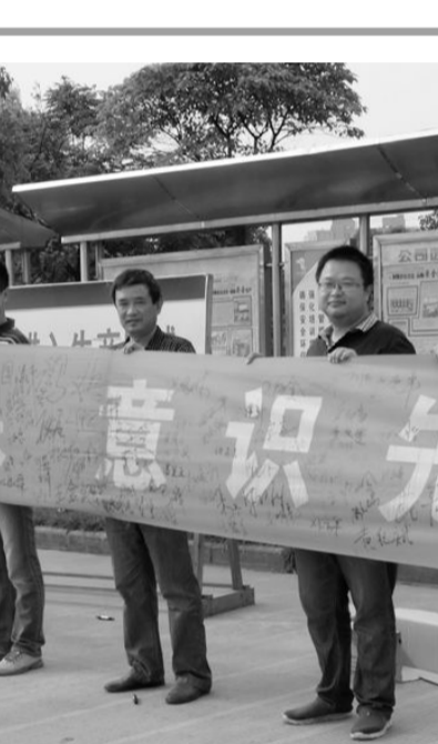
日前,金成铜业公司职工正在展示安全宣教活动职工签名。为开展好“安全生产月”宣教活动,该公司结合集团公司正在开展的“安全环保,意识先行”活动,围绕“安全生产月”活动主题,拟定了安全生产宣传咨询日、安全生产检查和查找隐患、专兼职安全员安全知识培训、安全生产应急预案演练等一系列活动。目前,部分活动正在开展中。

岗位上,以一丝不苟的态度、精湛的业务和严谨的工作作风,为矿山建设做出了一名矿山女工应有的贡献。副井卷扬机房担负着全矿上下人员、物料、矿石的提升任务,安全责任大,技术含量高,要求卷扬机司机既要有高度的责任心,又要有过硬的专业技术和熟练的操作技