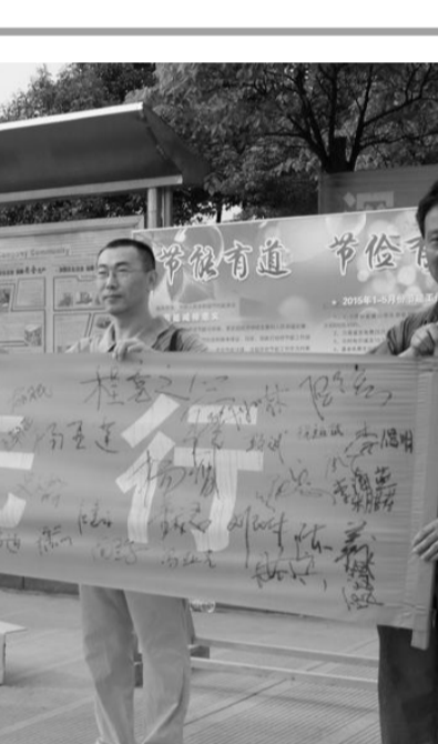
日前,金成铜业公司职工正在展示安全宣教活动职工签名。为开展好“安全生产月”宣教活动,该公司结合集团公司正在开展的“安全环保,意识先行”活动,围绕“安全生产月”活动主题,拟定了安全生产宣传咨询日、安全生产检查和查找隐患、专兼职安全员安全知识培训、安全生产应急预案演练等一系列活动。目前,部分活动正在开展中。

能。为此,赵国霞刻苦钻研业务,时刻紧绷安全这根弦。卷扬机属大型机电设备,配套的大小小设备有十几部件,每个部件机电设备运行参数和运行状况都不是一成不变的,一般情况下都会在基础数据范围内上下、左右波动,赵国霞经过长时间的摸索,通过“听、看、摸”就可判断并调