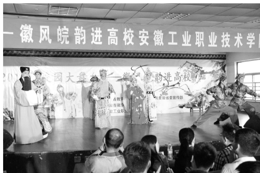
日前,2015年校园大舞台——徽风皖韵进高校活动安徽工业职业技术学院走进安徽工业职业技术学院。来自省徽京剧团的众多名家为该校师生带来了一场精彩纷呈的视听盛宴。