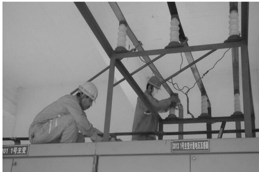
日前,凤凰山矿业公司机运车间组织专业人员对变电所两层35千伏和6千伏开关室内的所有供电设备设施进行了彻底清理除尘,并逐一紧固了母排和电缆头的连接螺栓,更换了表面有闪络的支柱瓷瓶。此举将有效保障该公司供电系统安全运行的可靠性。

本报讯 随着梅雨季节的到来,铜冠冶化分公司针对可能发生的暴雨、雷电等强对流天气,积极做好安全排查和防控工作,确保安全生产。 在对强对流天气防范工作中,该公司着重加强11千伏变电所、各车间间低压配电房和循环水泵房、危险化学品、输酸及输油气管道、酸库地槽、油库、园区区域排水、轻质雨棚、电缆桥架、现场项目施工和货物堆场维护等重点部位的防汛安全措施落实。 该公司要求各车间成立防汛防汛领导小组,制定落实相应的应对措施预案。做好应急物资蛇皮袋、锹、潜水泵等防汛防汛物资的储备。切实做到防汛器具设备、设施处于完好状态,保证各类应急器材用之即来,来之能用,