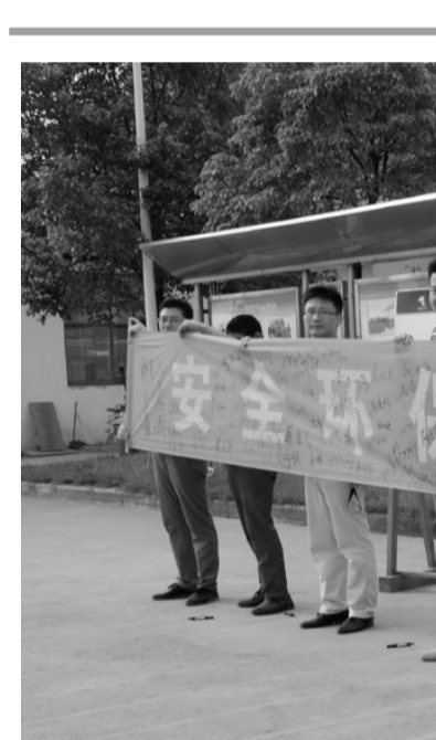
日前,金成铜业公司职工正在展示安全宣教活动职工签名。为开展好“安全生产月”宣教活动,该公司结合集团公司正在开展的“安全环保,意识先行”活动,围绕“安全生产月”活动主题,拟定了安全生产宣传咨询日、安全生产检查和查找隐患、专兼职安全员安全知识培训、安全生产应急预案演练等一系列活动。目前,部分活动正在开展中。王红平 黄军平 摄

标的好坏直接影响企业经济效益。2014年是该车间转炉渣生产的第一年,不仅新增了15万吨转炉渣处理任务,并且存在处理能力低、原矿品位波动大等诸多难题。在生产过程中,该班及时总结和固化工艺操作标准,积极改进工艺设备,加强浮选液、细度控制,严格药剂和钢球添加标准,较好地解决了生产出现的各类问题,使转炉渣生产指标稳步提升。同时,电炉渣生产指标和作业效率在原有基础上进一步提升,回收率、尾矿含铜等主要经济技术指标创造投产以来最好水平。 实现安全环保“零事故”。该班扎实开展安全环保宣传教育,认真抓好安全卡填写、安全宣誓、安全生产月等活动,提高全员安全意识,加强现场监管,做好生产和检修期的安全监督检查,保障生产安全稳定。落实环保措施要求,强化环