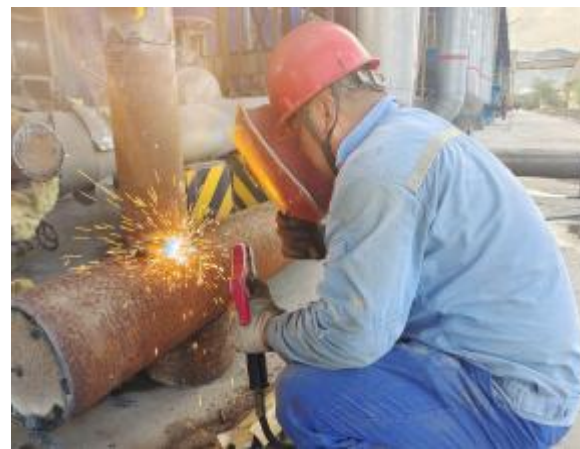
为了消除溢流风险,近日,热电厂对140万吨循环水池管道进行了改造。该分厂利用原氧化铝I、II系列停运后的闲置管道,把140万吨循环水池一部分循环水引流至80万吨循环水池,缓解了140万吨循环水池压力,避免了环事故的发生,确保了生产安全稳定运行。上图为检修人员正在改造管道。