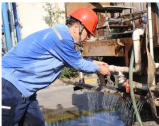
近期,热电厂党委扎实开展“两带两创”活动,该厂电业工区党员利用闲置泥车和3个废旧混凝土车,主动承担起分厂辖区主马路的环保洒水及绿化带浇水任务,大大改善了厂区马路扬尘现象。