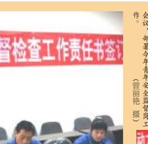
下图:近日,动力厂团委召开工作会议,部署今年青年安全监督岗工作。

本报讯 为落实建设具有铝特色的“和谐共赢”企业文化目标,培育共同价值观,1月12日,氧化铝厂党委召开会议,研究制定加快企业文化建设步伐,使企业文化尽快形成文化力、执行力、生产力,成为推动氧化铝发展和提升效益的强大精神动力的规划。(赵光宇)