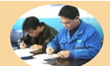
上图:热电厂锅炉车间工会组织各工段小组长签订2007年员工“安全互保协议书”。