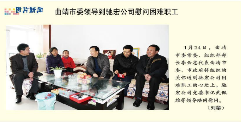
曲靖市委领导到驰宏公司慰问困难职工