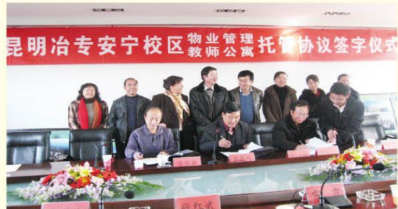
1月20日，金水物业公司和昆明治专举行了昆明治专安宁校区物业管理教师公寓托管协议签字仪式，这是金水物业公司今年签订的第三个管理项目。（董琳）