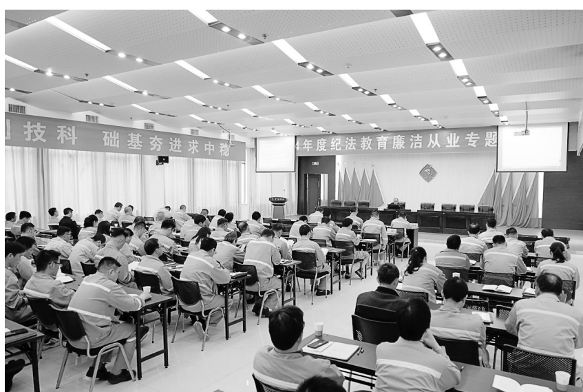
图为金冠铜业分公司党委开展廉洁从业专题培训。

为加快建设花园式工厂、提升员工工作热情,该公司全力推进厂区规划整改、绿化亮化提升工作,不断优化厂区环境。实施车间班组控制室、厂区道路拓宽和亮化等多项现场专项整改,花园式工厂建设不断取得新的成果,整体环境焕然一新。该公司获评铜陵市“市级园林式单位”称号,成为铜陵市工业重点参