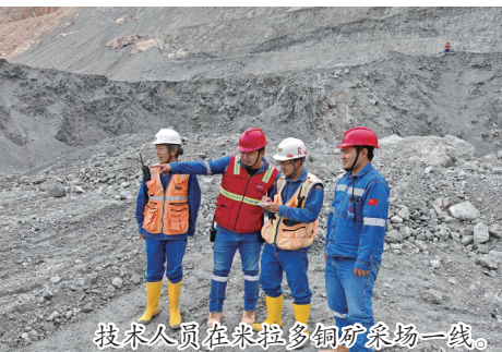
技术人员在米拉多铜矿采场一线。

新春的钟声敲响,当家乡的烟火与团圆成为寻常风景,在遥远的南美安第斯山脉深处,厄瓜多尔米拉多铜矿的工地上,一群海外建设者正以另一种方式守护着“年”的意义。他们告别故土,把思念化作坚守,用汗水守护生产,在异国他乡书写着属于奋斗者的新春故事,也见证着公司“走出去”战略的坚实步伐。