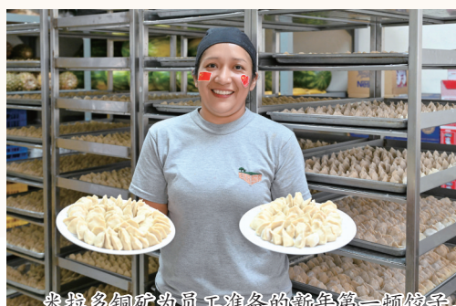
米拉多铜矿为员工准备的新年第一顿饺子。

马年初一凌晨四点,米拉多铜矿尚笼罩在墨蓝色的夜色中,电工班组的值班室却早已亮起了灯光。为保障现场检修正常开展,电工班组提前进场,力争在检修工作开始前完成倒电工作。