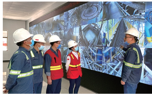
米拉多铜矿选矿车间中心控制室。

辞暮尔尔,烟火年年。在阖家团圆的春节时刻,远在万里之外的厄瓜多尔米拉多铜矿却呈现出另一番动人景象。为保障公司生产经营稳步前行,全力夺取2026年“首季开门红”,广大干部员工舍小家为大家,坚守岗位,用汗水与奉献诠释责任担当。