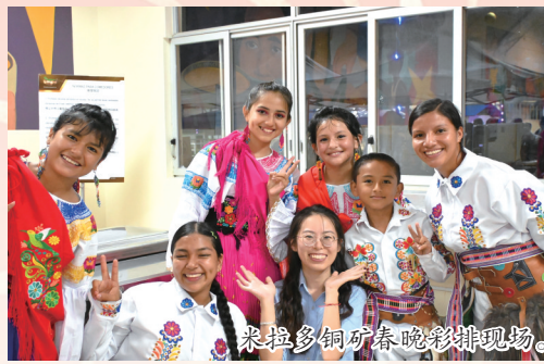
米拉多铜矿春晚彩排现场。

在赤道的雨季里,新年正悄悄靠近。作为集团海外项目的一员,这是我第一次在远离故土的地方过年。