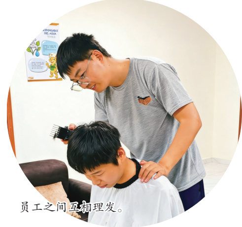
员工之间互相理发。

新春佳节,万家灯火团圆之际,远在安第斯山麓的厄瓜多尔米拉多铜矿依旧灯火通明、机器轰鸣。一批去年入职的青年员工即将在安第斯山下度过一个温暖而又特别的春节。