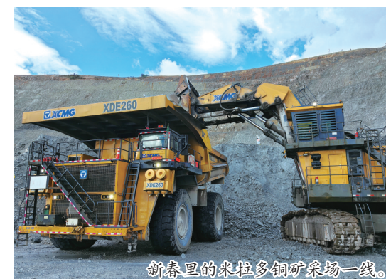
新春里的米拉多铜矿采场一线。

夜幕降临,采场灯光点亮,运输车辆在既定路线中穿梭。我站在边坡上,看着井然有序的生产现场,心里多了一份踏实。春节坚守,没有轰轰烈烈的壮举,只