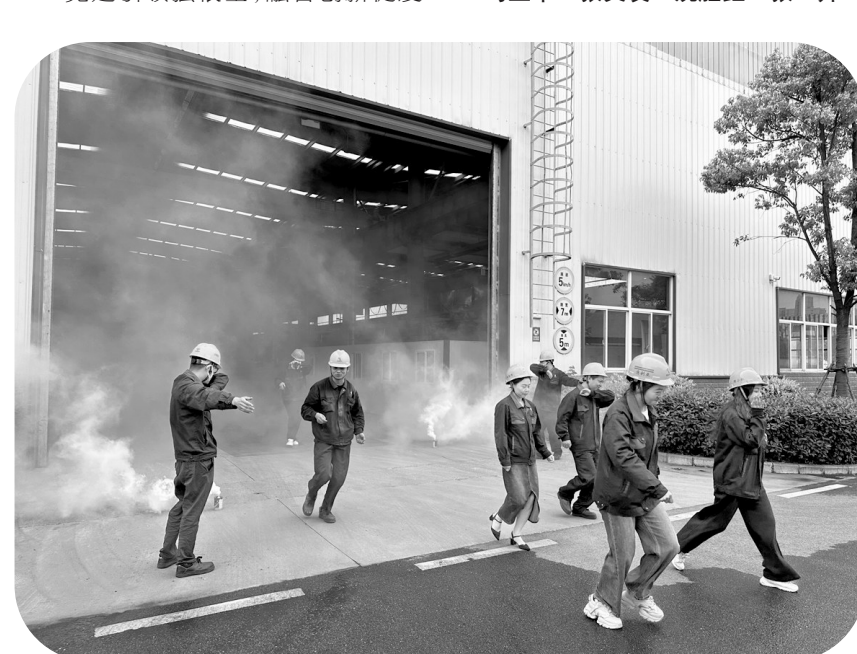
图为铜冠建安钢构公司党支部组织开展的应急演练现场。