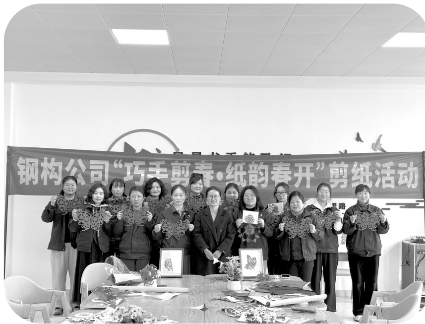
图为铜冠建安钢构公司党支部开展“巧手剪春,纸韵春开”妇女节剪纸活动。

党支部堡垒作用显著增强。在急难险重任务中,该党支部努力提升其组织力、凝聚力、战斗力,广大党员始终冲锋在前,有效保障了多项重点工程优质高效履约,铜冠建安钢构公司也因此多次收到业主单位的表扬信。近年来,该党支部荣获铜冠建安公司和集团公司“先