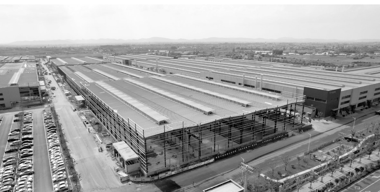
图为铜冠建安钢构公司施工的马鞍山天能项目建设现场。