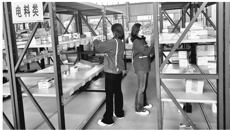
图为铜冠矿建公司工贸分公司库管员正在清点待发物资。

春意渐浓,万物竞发。在铜冠矿建公司,有这样一群女工,她们扎根于物资采购、仓库保管、门岗管理等岗位,默默奉献,用实际行动诠释责任与担当,撑起了铜冠矿建公司