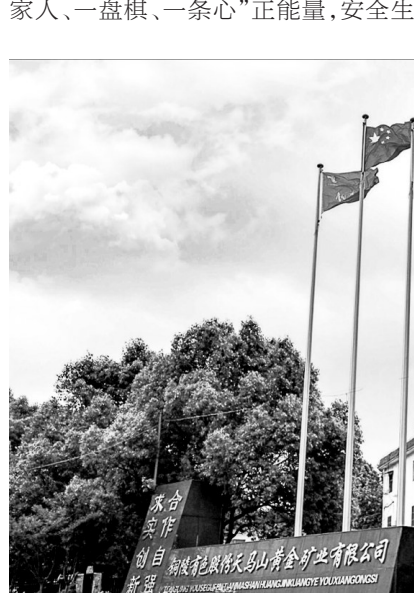
图为天马山矿业公司门前全景。

党建领航方能逐浪远航。面对连续亏损的局面,天马山矿业公司党委以习近平新时代中国特色社会主义思想为指导,充分发挥党建工作铸魂塑魄、凝聚人心的强大力量。将党的领导融入企业改革发展各个环节、各个环节,开启了党的建设和生产经营深度融合新局面。以创建“天马先锋·聚力铸魂”党建品牌为载体,聚合起“一家人、一盘棋、一条心”正能量,安全生