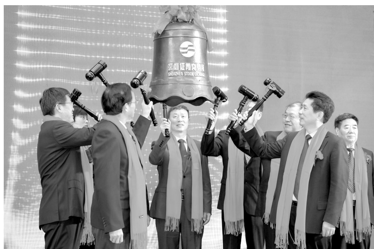
图为该公司在创业板上市敲钟。

年6月22日,铜冠铜箔正式取得了池州市市场监督管理局核发的股份公司营业执照,标志着安徽铜冠铜箔集团股份有限公司的正式成立。这一重大改革不仅为铜冠铜箔的未来发展注入了新的活力,也为其进一步拓宽融资渠道、优化公司治理结构奠定了坚实基础。