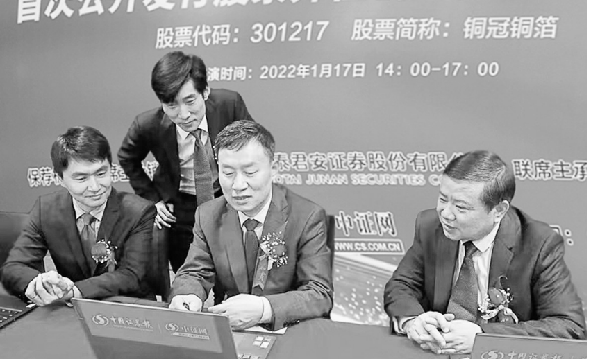
图为该公司在路演现场答复网上投资者提出的问题。

铜冠铜箔技术工艺水平居国内前列、国际先进,是中国电子材料行业协会副理事长单位、电子铜箔分会理事长单位,先后入选省国资委创新改革试点单位和国务院国资委“国企双百行动”企业名单。铜冠铜箔年产各类高精度电子铜箔8万吨(其中锂电用铜箔4.5万吨),是国内规模最大电子铜箔生产企业之一。铜箔板块已成为铜陵有色金属集团控股有限公司(以下简称“集团公司”)转型发展的新名片。