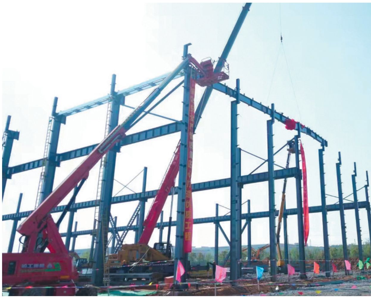
4月5日8时58分,铜冠建安钢构公司承建的金神耐磨1号高韧初新型材料生产联合厂房首根钢梁顺利吊装就位,标志着工程正式进入钢结构主体施工阶段。据悉,该厂房建筑面积约为15201平方米,此次吊装的单根钢梁跨度约为30米,预计6月30日完成三个区域全部钢梁的吊装及维护工作。

键启停,智能识别装载点漏斗、道岔状态、自动加减速点、自动升降弓点,以及危险区域人员进入等异常行为,及时报警并联动控制。“我们紧盯目标任务,优化劳动组织,开展技术攻关,健全激励制度,以有力举措提高运输管理,坚决完成每月运输任务。”运输区党支部书记周孝金表示。 进入维修间,只见机器轰鸣,火花飞溅,忙碌的身影穿梭在厂房间。职工们有条不紊地焊接、检修,埋头苦干,一刻也不松懈。“职工们积极响应矿部过‘紧日子’的理念,从身边触手可及的点滴做起,营造了人人能节支、全员降本增效的良好氛围。一季度,车间修旧利废创效近10万元。”动力车间主任李晓东介绍。