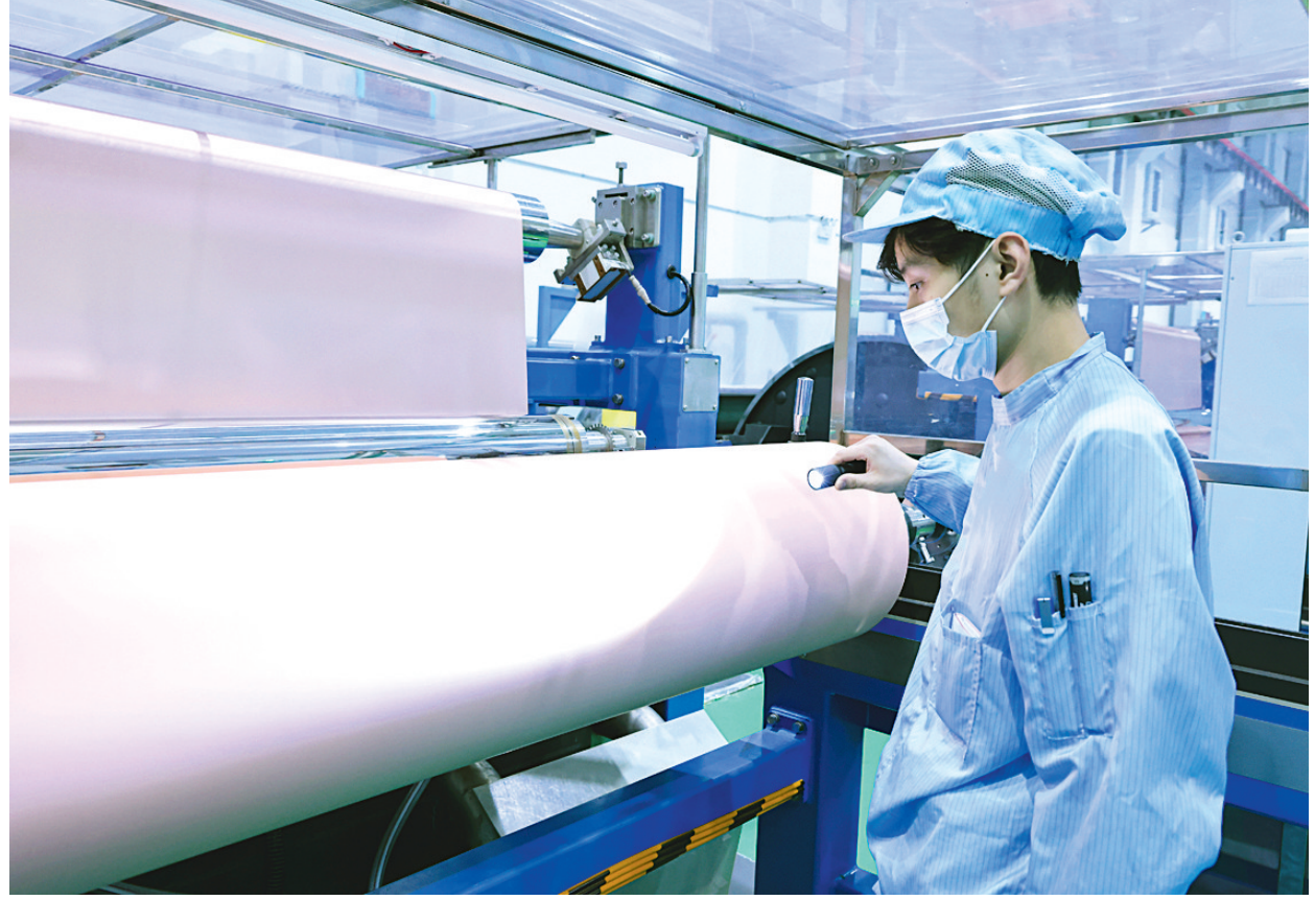
10月1日,铜陵铜箔公司员工正在生产作业。该公司面对今年铜箔行业竞争加剧,积极通过加强生产组织抗拒风险。赶上中秋和国庆长假,该公司组织员工坚守生产一线,开展正常生产作业,保障了节日期间生产稳定。

本报讯 日前,安庆铜矿主井第一钩矿顺利进入铜矿仓,三台球磨机正常运转,“一条龙”生产正常运行标志着该矿年度大修工作已圆满完成。 该矿将本年度检修工作作为一次设备设施的“健康体检”,针对各生产系统、重点场所和重要岗位制定全面的检修计划及安全保护措施,明确检修任务、项目、时间和责任人,确保把检修工作的每一个环节落到实处、检修责任分配到个人。 检修期间,从矿领导到车间区长,所有管理人员根据分工,坚持“盯现场、抓关键、抓进度、抓质量、抓安全”方针,24小时坚守岗位,确保检修安全高效有序进行。 该矿将检修工作关口前移,建立系统检修人员组织架构,管理人员“纵向到底”,按职责划分检修责任,各专业组技术指导“横向到边”,按设备制订专项方案。全体员工围绕“零事故、高质量、高效率”的检修目标形成合力,形成“人人肩上有担子,人人有担当、大事小事有人管、沟通协调不费力”的工作氛围。 该矿与外委施工单位、各基层检修参建单位达成共识,将所有参与大修的施工人员进行统一管理。根据不同区域、不同级别的检修内容,针对性开展岗前培训,进行施工作业安全风险评估,学习同类型事故案例,指导进行安全作业行为,有效排除人员危险因素,降低安全风险。