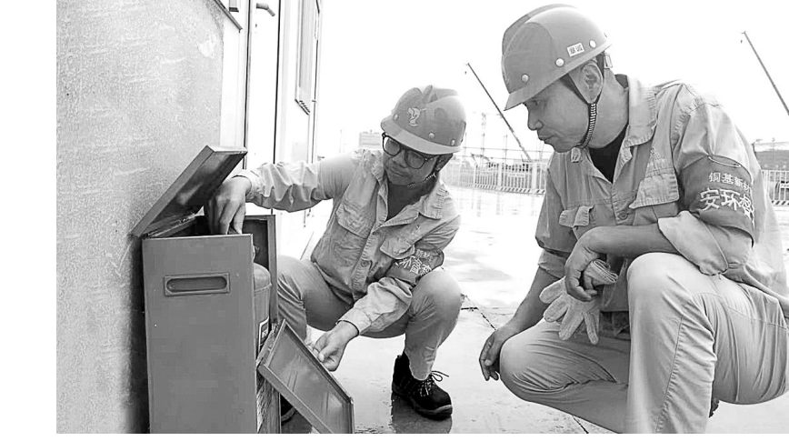
为切实做好中秋和国庆“两节”期间消防安全工作,铜基新材料项目部节前在各区域施工现场开展消防、临时用电、安全生产专项检查。严格按照“五落实”要求,做好隐患排查和整改工作,确保施工安全。