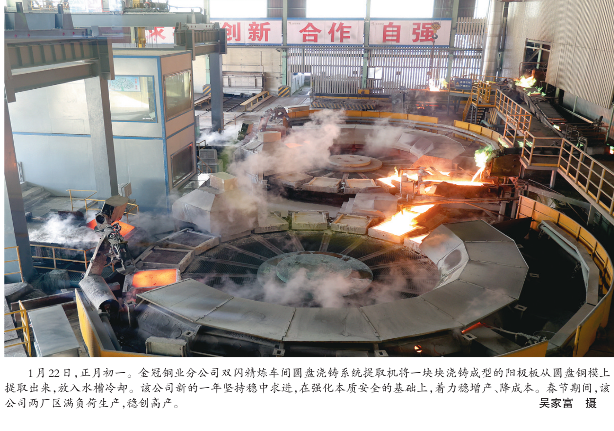
1月22日,正月初一。金冠铜业分公司双闪精炼车间圆盘浇铸系统提取机将一块块浇铸成型的阳极板从圆盘铜模上提取出来,放入水槽冷却。该公司新的一年坚持稳中求进,在强化本质安全的基础上,着力稳增长、降成本。春节期间,该公司两厂区满负荷生产,稳创高产。