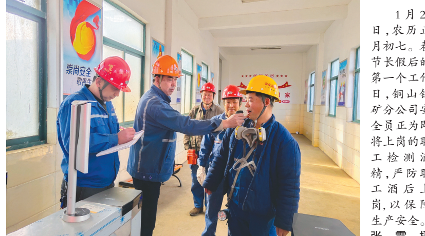
1月28日,农历正月初七。春节长假后的第一个工作日,铜山铜矿分公司安全全员正即将上岗的职工检测酒精,严防职工酒后上岗,以保障生产安全。