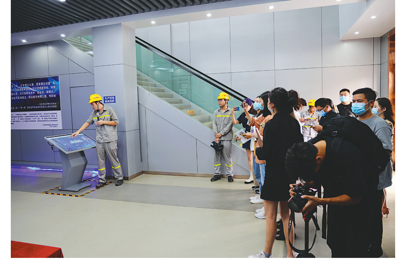
8月30日,市委宣传部门陪同央广网、中安在线、安徽日报等媒体记者一行近20人,来铜冠铜业分公司,开展“牢记嘱托谱新篇,砥砺奋进新征程——铜陵这十年”主题采访调研,并对该公司规模化建设、铜冶炼工艺技术、绿色发展及节能减排、智能化建设等高质量发展表现出浓厚的兴趣。

本报讯 日前,在铜冠矿建公司沙溪项目部负290米中段充填巷,技术人员、民爆公司培训人员、协作队伍掘进班联合进行了数码电子雷管首次试爆作业。随着一声巨响,试爆作业圆满完成。