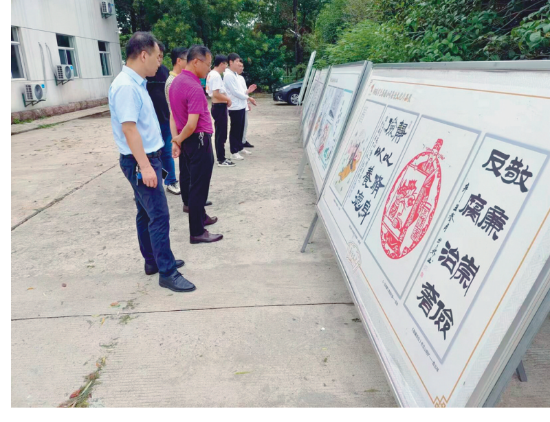
日前,铜冠房地产公司组织党员干部、入党积极分子和关键岗位职工集中观看集团公司廉洁文化作品展,进一步营造廉洁文化氛围,培养廉洁道德情操,充分发挥廉洁文化的教育引导作用。图为集团公司廉洁文化作品展现场。