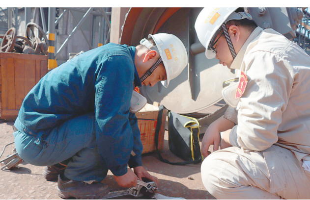
铜冠冶化分公司为节约成本,大力倡导修旧利废,加强对边角料的回收再利用。图为日前该分公司硫酸车间员工对拆下来的旧压力阀进行拆解,留下能继续使用的部件。