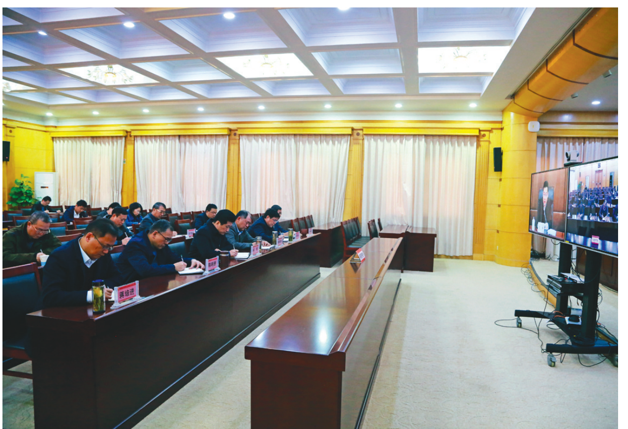
11月25日下午,省国资委召开了省属企业虚假贸易专项整治动员部署暨低效无效闲置资产清退处置工作推进会。会议采取视频会议方式召开,省国资委领导班子成员、监事会主席、二级巡视员等在国资委主会场参加会议,集团公司党委领导班子成员杨军、龚华东、陈明勇、汪农生、蒋培进、陶和平,集团公司财务部等相关部门负责人在公司分会场参会。会上,省国资委党委书记、主任李中作了重要讲话,传达学习省委书记郑栅洁针对省属企业的重要讲话精神,就整治省属企业虚假贸易问题,清退处置低效无效闲置资产工作提出了要求。