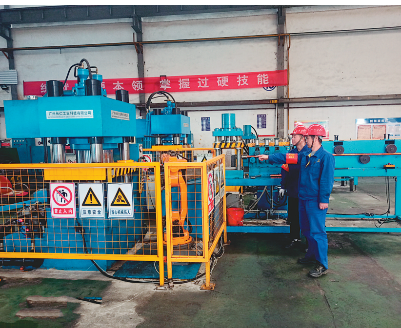
近日,铜冠电冶公司以一线班组为单位,开展“安环监督员红袖章”活动。每周指定一名班组长或班组成员作为当班安环监督员,每天在车间作业现场及公司周围进行安环巡查,在全公司范围内行使安全、环境监督管理权。图为安环监督员正在生产现场查违章、查隐患。

专家委成员,集团公司、股份公司机关各部门主要负责人,各基层单位党政主要负责人参加会议。 萨百灵