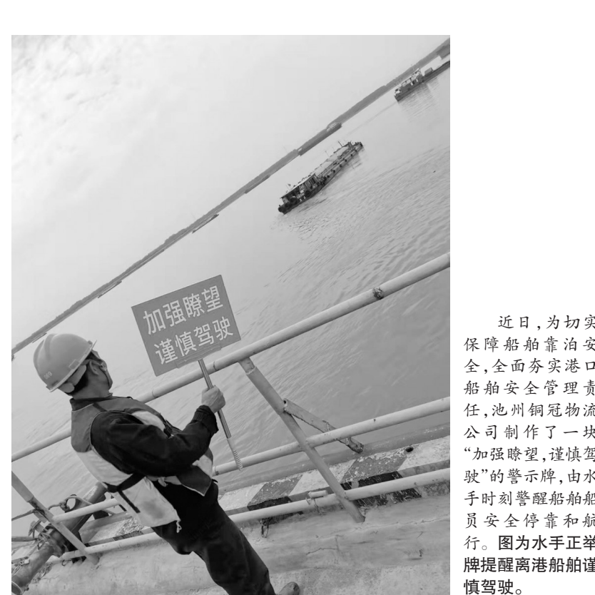
近日,为切实保障船舶靠泊安全,全面夯实港口船舶安全管理责任,池州铜冠物流公司制作了一块“加强瞭望,谨慎驾驶”的警示牌,由水手时刻警醒船舶驾驶员安全停靠和航行。图为水手正举牌提醒离港船舶谨慎驾驶。