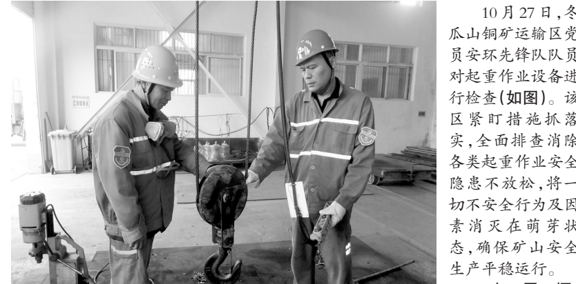
10月27日,冬瓜山铜矿运输区党员安环先锋队队员对起重作业设备进行安全检查(如图)。该区紧盯措施抓落实,全面排查消除各类起重作业安全隐患不放松,将一切不安全行为和因素消灭在萌芽状态,确保矿山安全生产平稳运行。