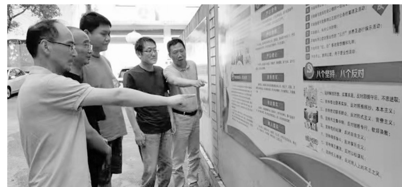
9月17日,铜冠投资公司经贸分公司员工在廉政文化墙前,就党员干部廉洁从业、廉政文化建设等方面展开讨论。今年以来,该公司将廉洁从业规章制度、廉政文化的基本常识与内涵统一以展板规范展出,放置于公司大门前,让干部职工充分了解并做好廉政建设监督。