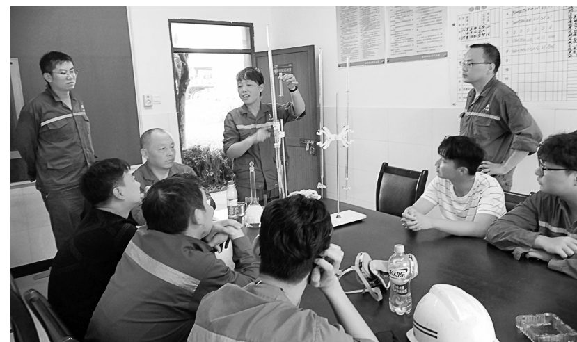
金隆铜业公司化验高级技师正在对磨矿、浮选工进行矿浆酸度PH测定专业培训(如图)。该公司为全面提升员工选矿专业技能,促进渣选生产,有针对性地对渣选车间生产工人进行岗位培训,以提高员工实践技能水平,保证生产高质量生产。