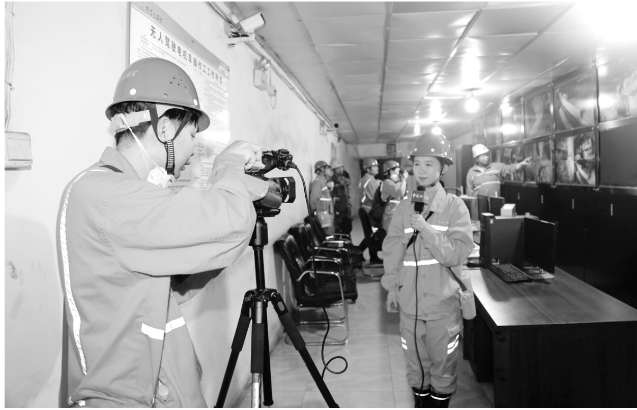
9月17日,中国新闻社安徽分社一行四人深入冬瓜山铜矿井下负960米采矿业点了解出矿生产情况,并在井下负1000米监控站实地拍摄井下无人驾驶电机车实时操作场景(如图),通过镜头记录矿工工人千米井下的工作情况,展现科技给矿山带来的变化。