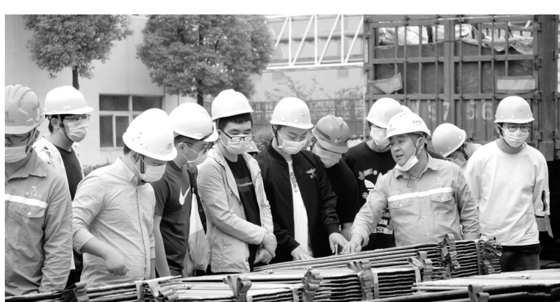
5月18日，江苏科技大学一行50余人到张家港铜业公司参观学习。此次活动使高校毕业生更加直观地了解企业，对于企业人才引进和毕业生就业具有双向促进作用。