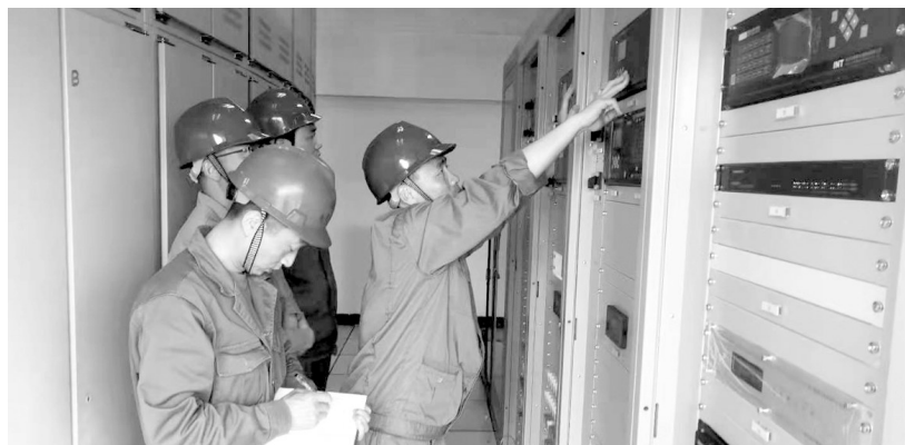
5月3日，电气检测中心工作人员携带相关试验设备前往金威铜业分公司110千伏变电所，经过反复“试验—调整—试验”，于当日22时40分完成2台主变微机保护装置校核和传动试验。日前，该新系统已成功投入运行。