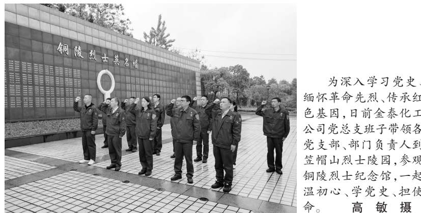
为深入学习党史、缅怀革命先烈、传承红色基因,日前金泰化工公司党总支支部带领各党支部、部门负责人到笠帽山烈士陵园,参观铜陵烈士纪念馆,一起温初心、学党史,担使命。