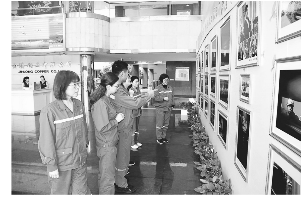
为迎接中国共产党成立100周年,展示积极向上的企业文化风貌,日前铜陵铜业公司工会举办了“歌颂建党伟业、展现职工风采”职工摄影展,热情讴歌党的伟大和职工的真善美。图为职工正在观看展出的摄影作品。

本报讯 4月27日,铜冠(庐江)矿业公司“最美劳动者”摄影展正式开幕。此次活动广大员工广泛参与,纷纷走进基层一线,用手机捕捉眼中最美的劳动者。此次征集的“最美劳动者”照片共有93幅,其中《化石点金》《火热的劳动场面》《齐头并进》等一批来自基层的优秀图片,源于身边工友的感人画面,既弘扬了劳动者的高尚品质,也感召身边员工向他们学习,受到员工们的一致赞许。