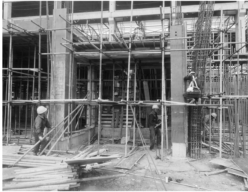
铜冠建安公司承建的江西汇盈电解项目电解工序附跨工程日前正在加紧施工中。进入四月份,该项目土建、安装、钢构、防腐等专业展开连续的施工大干,项目部合理组织现场人材机资源,努力提高工作效率。