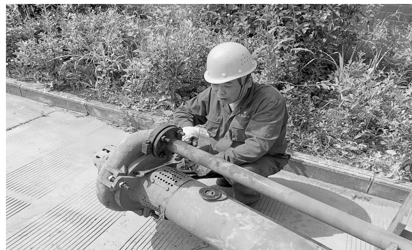
日前,天马山矿业公司以“保生产、反三违、除隐患、大干100天”活动为契机,强化设备维修与保养,确保公司安全生产。图为该公司充填工区员工对沉淀池吊泵进行维修。