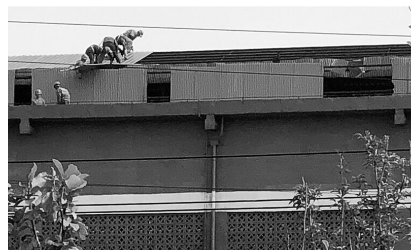
冬季即将来临,金隆铜业公司提前预判,对可能影响企业正常运行的诸多不利因素进行排查整改,以消除相关隐患。该公司对各类机械设备、蒸汽管道、空调设施等全面检查,对检查出来的问题,督促属地方立即整改,确保冬季安全生产。图为房屋修缮人员正在对该公司原料仓顶棚盖瓦进行更换加固。

好几位工友也跟着举起智能手机与新颖的“班组园地”拍合影,并随即上传至“朋友圈”或“微信群”。眼前的“安全园地”栏,变身成班组“网红墙”。汪为琳