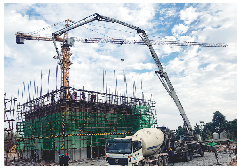
10月25日,铜冠建安公司第二建筑工程事业部承建的冬瓜山铜矿新辅助井井塔工程正在进行剪力墙9米高度的砼浇筑施工。该公司事业部积极投入劳动力,抓住当下晴好天气,精心组织施工大干,完成剪力墙砼浇筑作业,即进行制作一层平台梁板钢筋,有序推进工程进度,争取年底主体结构施工完成。