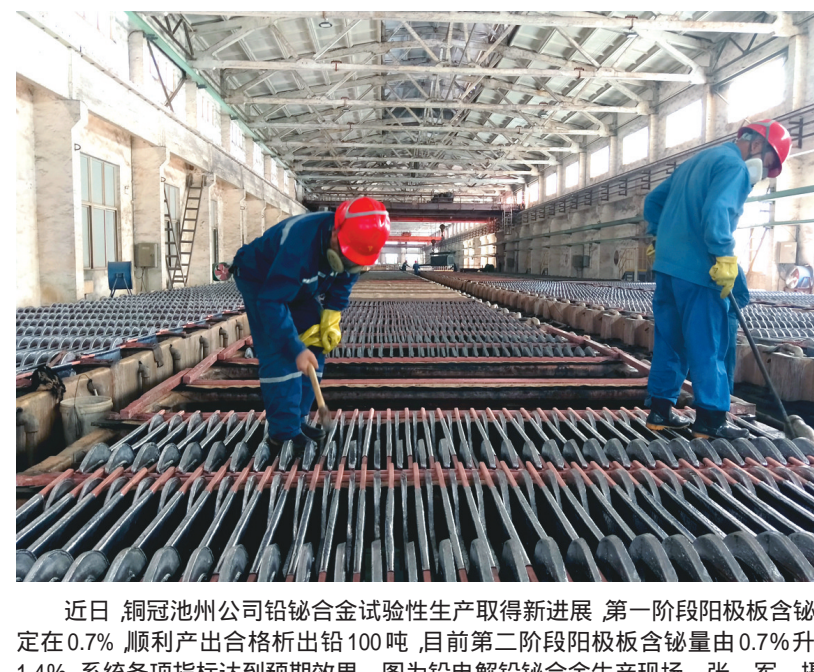
近日,铜冠池州公司铅铝合金试验性生产取得新进展,第一阶段阳极板含铋稳定在0.7%,顺利产出合格析出铅100吨,目前第二阶段阳极板含铋量由0.7%升至1.4%,系统各项指标达到预期效果。图为铅电解铝合金生产现场。