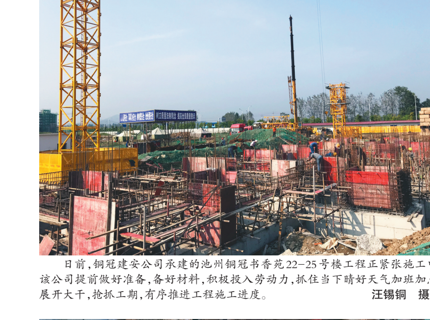
日前,铜冠建安公司承建的池州铜冠书香苑22-25号楼工程正紧张施工中。该公司提前做好准备,备好材料,积极投入劳动力,抓住当下晴好天气加班加点,展开大干,抢抓工期,有序推进工程施工进度。

护检测等设备电气检修。为此工区检修前及时召开年终检修动员会,将此次矿年终检修工区所涉及承担的项目、任务,对职工说清楚,将任务责任到人、安排到位。并对参与检修人员做好各项项目施工安全交底工作;检修前还组织专人对主井井架、井下主井和卸矿坑等涉及检修场地进行全面清理、整治,预防检修期间石块、杂物滑落,对人员造成安全事故,也尽力为检修人员创造一个良好的工作环境。 当日上午,选矿磨浮车间,电焊火花四射,行车川流不息,选矿干部职工及外协单位检修人员,正在为更换2号球磨机筒体技改、3号球磨机衬板及9号浮选槽体做清场准备工作。“我们选矿这些老设备、老电气,这次一定要发挥大家的智慧好好维修、改进,对在不能再坚持运转的设备,要及时更换。”选矿车间主任马家盛对一旁的技术员及分管设备的副主任说。 “为做好此次检修的后勤保障工作,食堂提前制定好检修期间伙食计划,提高伙食标准,及时采购新鲜的食材,精心烹制,努力让检修一线的食品职工吃上健康适口的工作餐。”矿食堂管理员杨晓红告诉笔者。 程海滨