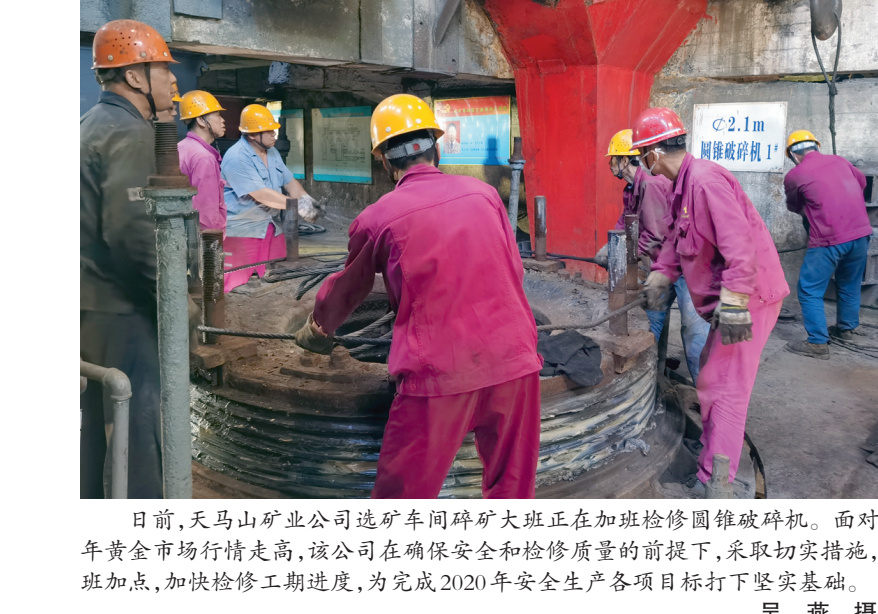
日前,天马山矿业公司选矿车间碎矿大班正在加班检修圆锥破碎机。面对今年黄金市场行情走高,该公司在确保安全和检修质量的前提下,采取切实措施,连班加点,加快检修工期进度,为完成2020年安全生产各项目目标打下坚实基础。