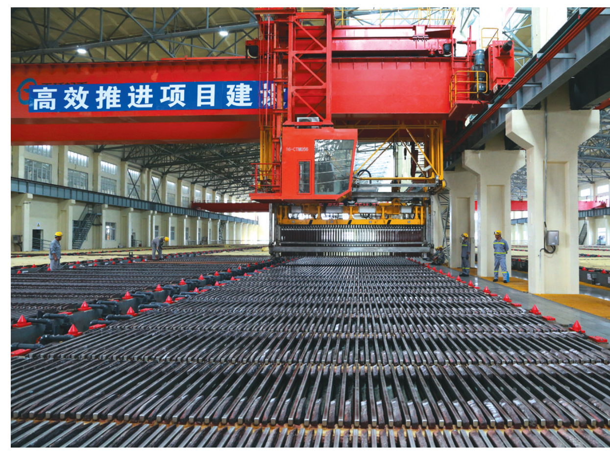
金冠铜业奥炉二期员工正在开展槽面作业。金冠铜业奥炉二期车间在新上的电解二期上树立精细化管理和操作理念,规范标准化作业,强化生产班组间的技术交流与相互协作,使得电解二期阴极铜产量稳步提升,同时各项经济技术指标持续改善,阴极铜优质品率和电流效率均稳定在99%以上,实现了投产后的稳定生产。

本报讯 当千家万户团聚享受中秋、国庆假期的时刻,有这样一群人,因为特殊的工作性质,依然坚守在岗位上。他们用智慧和汗水,为企业的发展贡献着自己的力量,成为节日里最美的一道风景。 10月1日国庆节,又是传统中秋佳节,铜冠电工公司的成品房内却是一片繁忙景象。为了确保发货及时,晁家宝7时30分就赶到了包装搬运现场,在成品库现场指挥叉车、货车车辆有序的装运。“都不记得有多少个节日没休息过了。说心里话都习惯了,要是在家休息还不习惯呢。”晁家宝说的实实在在。其实,国庆假期,这个公司营销部大部分员工都是这样放弃休息,坚守在各自的工作岗位上的。晁家宝说:“既然从事了这份工作,就要做好。”今年“双节”,晁家宝要加班4天,和他一样,营销部有9位同事也在坚守着。 为确保假期各项生产工作平稳有序进行,漆包线分厂和营销部提前就节日期间安全生产工作作出详细部署,精心组织,采取有效措施,制订应急预案,严格执行各项隐患排查制度,加强安全检查密度和力度,确保节假日期间安全生产工作发动到位、领导到位、措施到位、管理到位、检查到位;强化节日值班制度,全面加强安全管理,全力抓好生产经营。 华伟