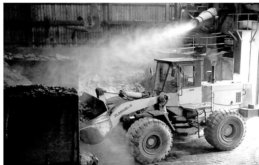
金隆铜业公司熔炼主厂房内，一辆铲车正在铲运包壳渣。在铲车工作的同时，旁边的雾炮机也同时工作，对准作业现场喷洒雾状水滴(如图)，以抑制扬尘。近年来，该公司将清洁、环保理念始终贯穿于生产经营全过程，确保环保受控，彰显国企担当。