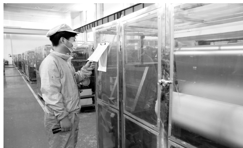
铜冠铜箔公司员工正在生产锂电箔(如图)。铜冠铜箔公司为做大市场规模，瞄准国内、国际两个市场，持续加强锂电箔生产销售。其中，将全力提高低端6微米锂电箔在销售中的占比，加大窄幅产品和低端锂电市场开发力度，尽可能消化半成品，最大限度降低库存。

做好后勤保障，为防汛排险保驾护航。在进入防汛工作之初，金铁分公司未雨绸缪，为队员们备足雨衣、胶靴、手电、铁锹等防护用品，在蹲守点闸口处架设了照明设施，便于夜间观察长江水位，及时掌握汛情。该公司还十分关心防汛队员的生活，每天中餐安排专人到指定的餐饮店取送餐饭到蹲守点，为队员们送去西瓜、矿泉水等水果、饮品，还配发了适量的方便面、火腿肠等食品用于夜间补充能量，较好地保证了防汛突击队员的生活，为做好防汛工作提供了有力的保障。邹卫东