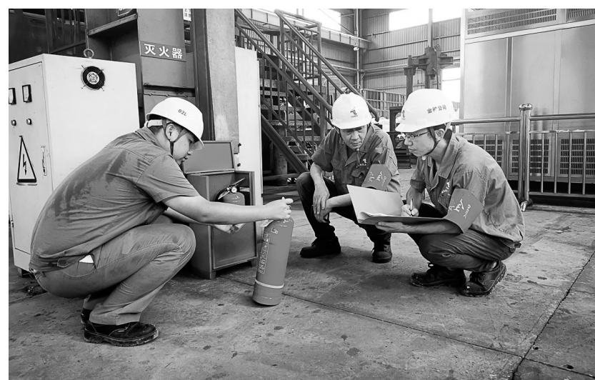
8月4日，铜冠投资金神公司组织人员对灭火器材进行检查(如图)。该公司针对夏季高温火灾易发特点，向员工开展灭火器材使用和应急救护等相关知识普及，提高职工自救、互救和扑救初期火情的能力。