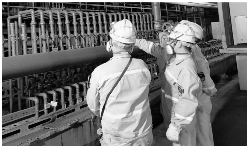
日前,金冠铜业分公司团委组织“奥炉”与“双闪”两厂区同类工艺生产车间青安岗相互开展隐患互查活动,排查整治安全隐患,规范岗位员工劳保品穿戴,确保安全生产、安全操作。