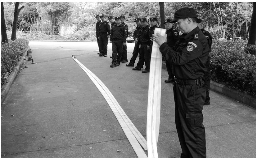
金隆铜业公司着力提升经济护卫队员的消防能力水平,有针对性地将对消防标准培训、器材使用、应急演练融入年度军训日程。通过持续业务练兵,不断强化保卫人员个人消防技能,为公司安全健康发展保驾护航。