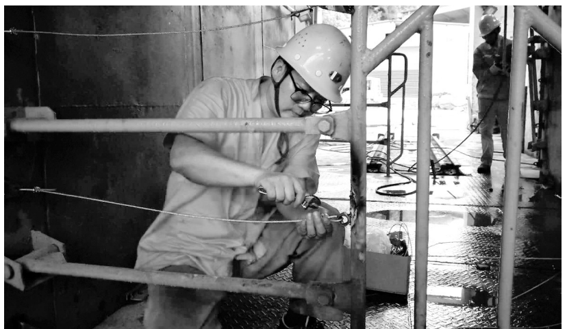
6月18日,冬瓜山铜矿提升二区维修人员利用自制部件,整改因山副井罐笼安全门挡(如图)。“安全生产月”期间,该区加大对副井提升环节的安全自查力度,对重点部位进行全面检查,发现隐患及时整改,保障安全生产。