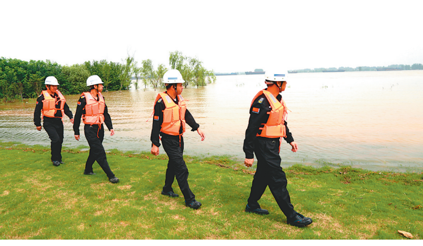
日前，金隆铜业公司经济护卫队正在长江干堤上进行汛期安全巡查。该公司承担着邻近厂区的约1000米长江干堤和两个道闸口的防守巡查任务，为了确保大堤安全，金隆公司每日派人巡查大堤，做到及时观察汛情，及时向防汛指挥部汇报汛情。

细致的拉网式巡回排查，对检查出的隐患和问题，落实整改责任，及时进行整改，并建立健全隐患整改台账和销案制度，确保隐患和问题整改到位，实现安全度汛。 强化防汛值班值守，做好应急准备。汛期严格领导带班、值班工作，落实交接班记录。重要部位和要害岗位24小时人员坚守岗位，认真巡查，不得脱岗，保持通讯和信息畅通、准确无误，及时有效地处理突发事件和信息报送。 强化防汛宣传提醒，增强责任意识。向各工程项目施工单位、物业小区业主等重点安全防汛人员进行防汛宣传，增加责任及风险防控意识。 强化防汛督查检查，确保责任落实。公司主要领导、分管领导、安环部、办公室四部门联合督查，对各工程项目、物管小区、东湖养殖等值班、巡查制度执行情况开展督查，确保防汛工作信息畅通。 周尚青