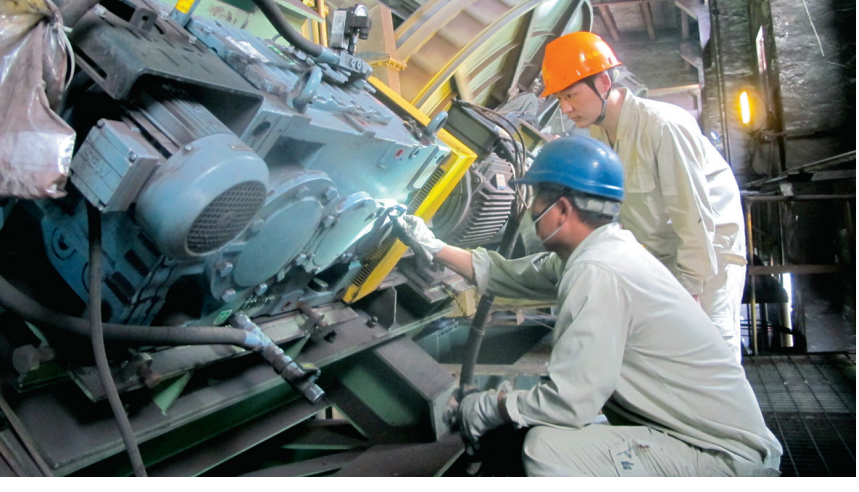
日前，铜冠冶金分公司球团车间员工检查球团机传动机构润滑情况。该分公司球团车间采取专项检查、重点抽查、全面检查等多种举措加强设备运行管理，每周一为“抓手”完善设备周检制度，落实设备责任到人，切实做好预防性维修，保证生产经营稳定。