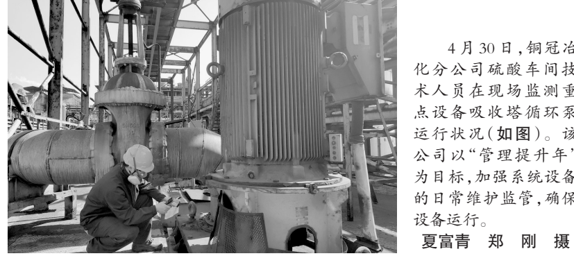
4月30日, 铜冠池州分公司硫酸车间技术人员在现场监测重点设备吸收塔循环泵运行状况(如图)。该公司以“管理提升年”为目标, 加强系统设备的日常维护监管, 确保设备运行。