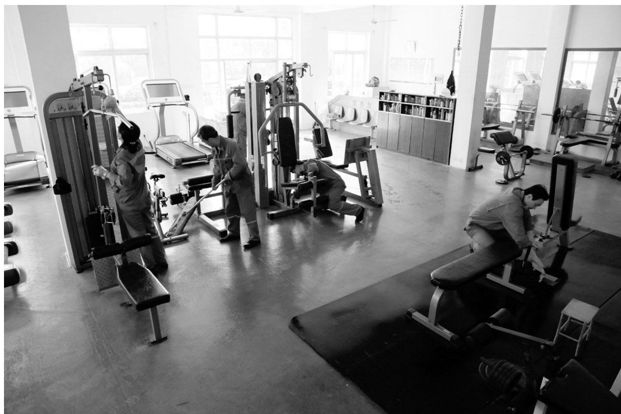
金隆铜业公司“党员活动日”已成常态化,该公司各党支部每月都会组织党员开展党日活动,倡导党员义务奉献,发挥党员先锋模范作用,充分体现共产党员的先进性。图为该公司党群党支部3月16日党日活动时,党员到员工健身馆清扫卫生的情景。