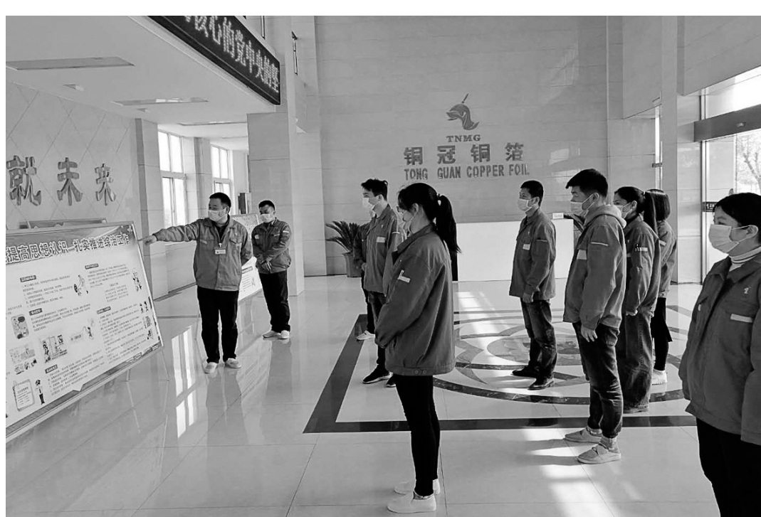
日前,铜冠铜箔公司广泛开展综治宣传月活动,通过悬挂宣传横幅、宣传资料发放、制作宣传展板等方式,向员工广泛宣传疫情防控、平安建设等方面的相关法律法规。图为员工正在利用宣传展板学习相关综治知识。