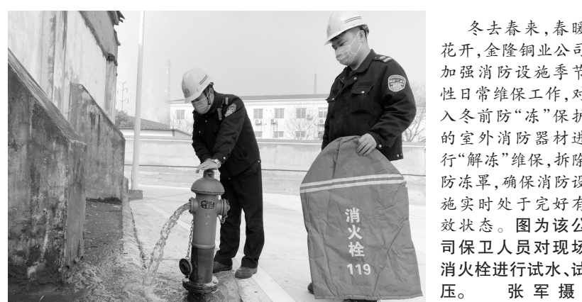
冬去春来,春暖花开,金隆铜业公司加强消防设施季节性日常维保工作,对入冬前“冻”保护的室外消防器材进行“解冻”维保,拆除防冻罩,确保消防设施实时处于完好有效状态。图为该公司保卫人员对现场消防栓进行试水、试压。