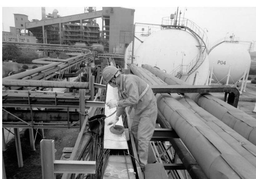
工程技术分公司认真做好安全、检修质量、疫情防控“三同步”,从严从细抓好现场安全管理,以意识提升为关键,以人员管理为重点,以措施落实为保障,确保实现安全检修。图为该公司循环园项目部金泰机械班检修人员正在金泰公司技改项目现场施工场景。