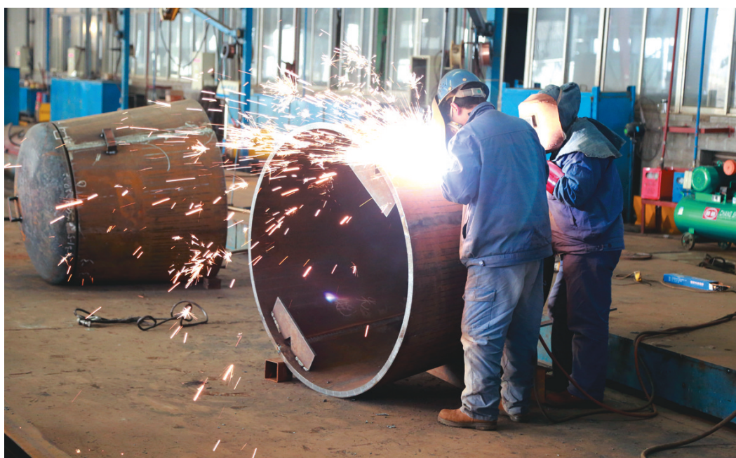
铜冠机械公司加工制造分厂员工正在打磨作业。铜冠机械公司加工制造分厂通过调派骨干力量全力开展加班、连班生产，疫情期间加工能力得到较好提升。