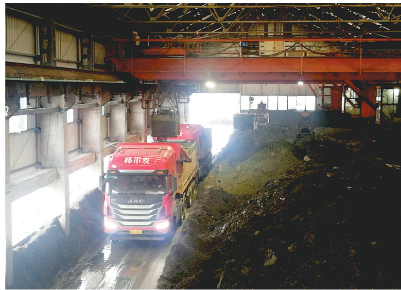
继夺取首月开门红后，2月份，天马矿业公司顺利完成金精砂含金19.1千克，硫精砂10320.5吨，分别完成月度计划的173.65%和155.50%，再次超额完成月度计划任务，夺取了防疫稳产双胜利。图为该公司硫精砂装车发货现场。

在项目部安全环保检查工作中，他服从安排听指挥，不论是分配他到各检修作业点巡检，还是分配他去安全风险较大的重点检修区域蹲守监督，他都毫无怨言，愉快接受任务。巡