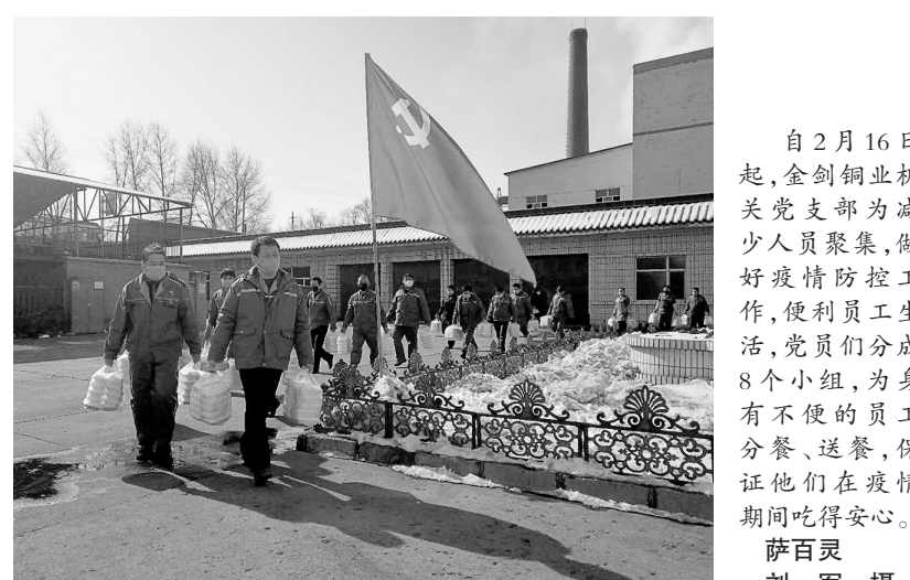
自2月16日起,金剑铜业机关党支部为减少人员聚集,做好疫情防控工,便利员工生活,党员们分成8个小组,为身有不便的员工送餐,保证他们在疫情期间吃得安心。