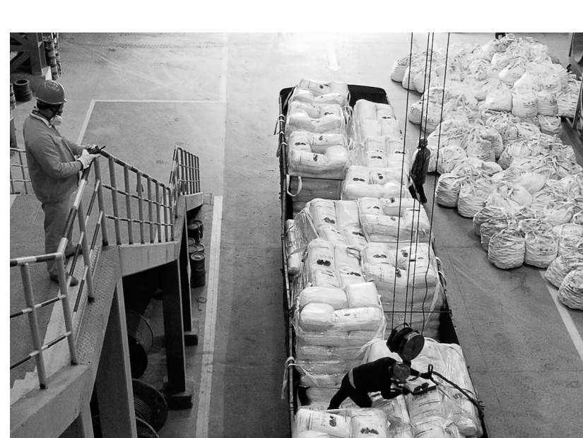
2月21日,安徽铜冠(庐江)矿业公司物资保障中心积极配合外省供应商,及时将选矿药剂配送到位(如图)。疫情期间,由于受交通管制影响,该中心将工作做在前面,提前和供货商沟通,全力配合完成车辆档案信息报备工作,做好生产经营后勤保障工作。