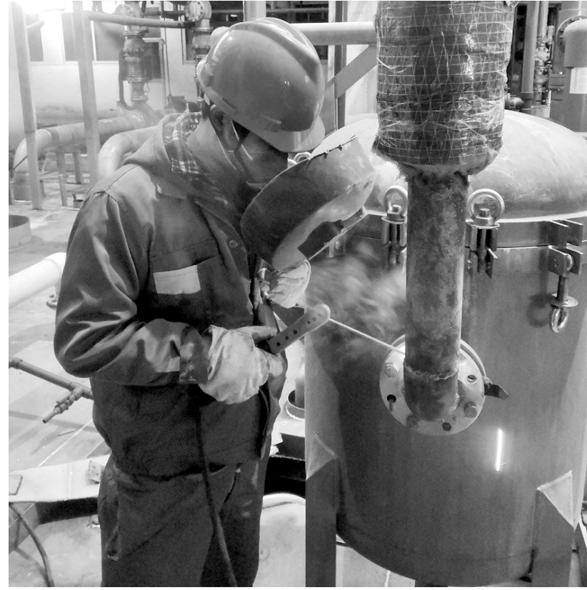
为了给全面复工复产打下坚实基础,铜冠铜箔公司坚决筑牢安全环保“防护墙”。日前,该公司铜箔一二工场组织维修人员对工场范围内的酸雾风机和设备管道进行保养维护。