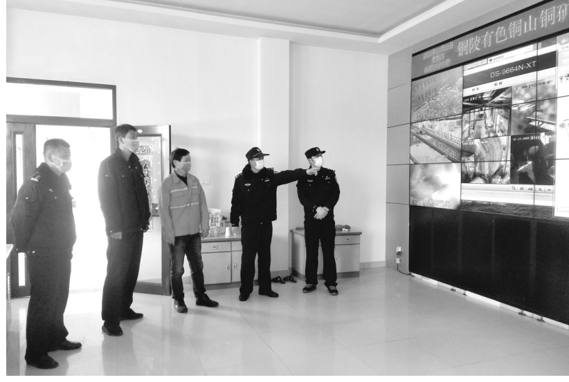
2月20日,市公安局铜山派出所民警深入辖区铜山铜矿分公司了解矿山复工复产及治安情况。在疫情防控的关键时期,该公司与当地派出所通过“一企一警”工作机制,加强警企联络,全力做好矿山复工复产后疫情防控和安全生产维稳复工复产。

本报讯 防控疫情,责无旁贷。铜山铜矿分公司保卫部全体成员坚守疫情防控“第一岗”,规划通勤车行驶路径和作业区域行走路径,封闭其他进入作业区域的进出口,安排专人负责,累计完成选矿处理量46万吨、铜精矿含铜1821.39吨,努力实现首季生产开门红。