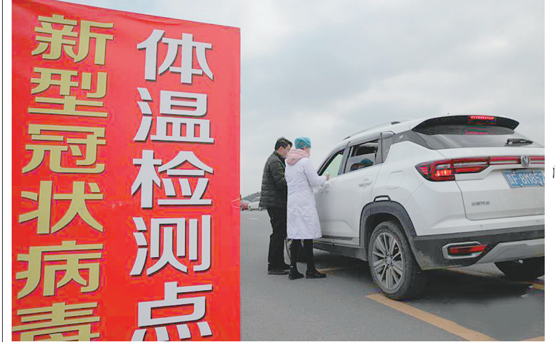
1月29日,贵州省毕节市黔西县多部门联合在贵黔高速黔西北站为过往车辆司乘人员测量体温。