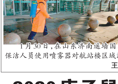
1月30日,在山东济南遥墙国际机场,保洁人员使用喷雾器对航站楼区域消毒。