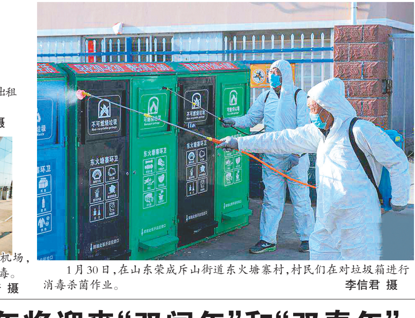
1月30日,在山东荣成斥丘街道东火塘寨村,村民们在对垃圾箱进行消毒杀菌作业。