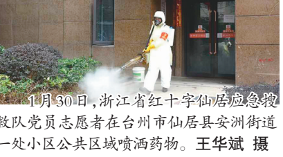
1月30日,浙江省红十字会仙居应急救援队党员志愿者在台州市仙居县安洲街道一处小区公共区域喷洒药物。