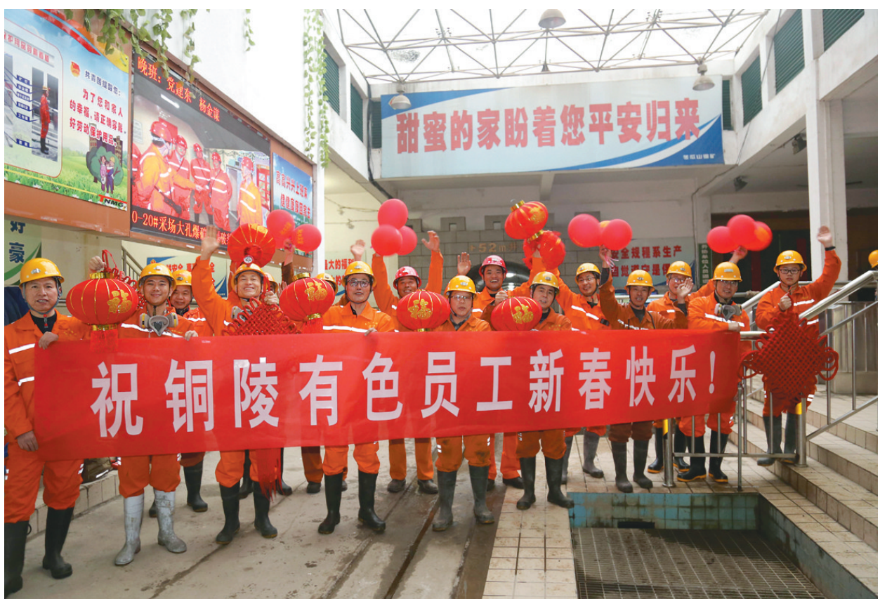
金鼠迎春来,矿山干劲浓。刚刚过去的一年,冬瓜山铜矿圆满完成了全年32000吨铜料任务,精矿含金完成839.45千克,精矿含银完成12726.97千克,主要产品产量和利润指标均超额完成公司下达的任务。新春佳节之际,这个矿广大干部职工坚守岗位,努力生产,创造佳绩,喜迎新年的到来。

近年来,铜冠铜箔致力于铜箔产品的研发、制造与销售,始终围绕这个主业进行研发、制造,并进行相关产品的拓展;积极推行精益管理,对公司业务流程及制造工序进行详细梳理,不断优化,减少过程中的浪费,达到缩短生产周期,提升效率,改善质量,降低成本和满足客户需求等目的;通过公司战略—优势—能力体系分析,结合现代工业技术、信息技术、管理科学等多方面技术融合,进行与战略一致的新型能力建设,实现公司可持续发展竞争力优势,打造铜箔产业品牌;以科技创新为第一生产力,结合技术创新和管理创新,为公司搭建高水平平台,推动公司核心竞争力持续发展。 何亮 王伟