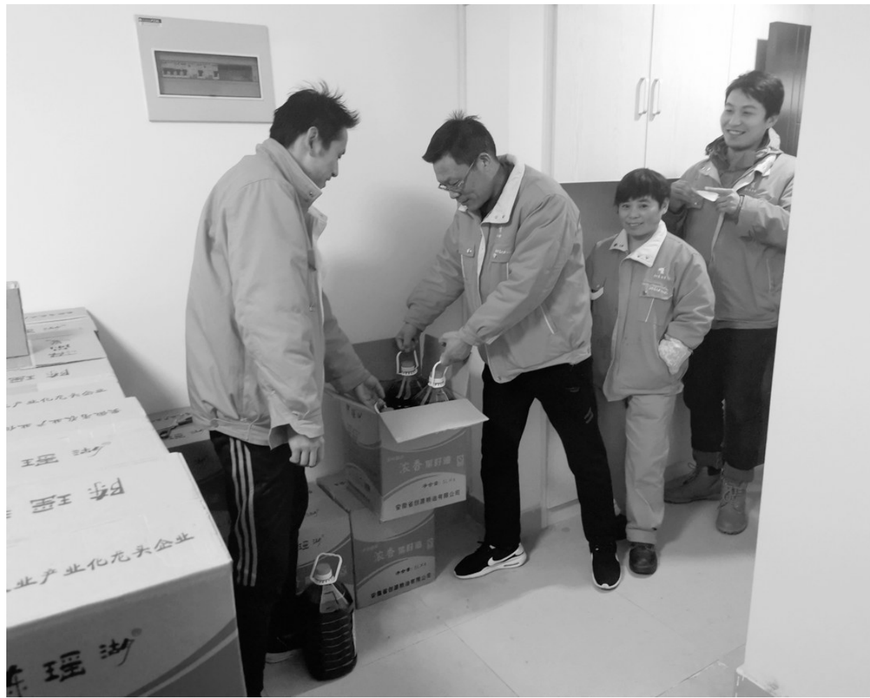
春节临近,铜冠(庐江)矿业公司将菜籽油、鸡蛋等春节福利发放到职工手中,为大家送去浓浓关爱与温馨祝福。此次发放的农副产品均购自集团公司精准帮扶的枞阳县各产业扶贫项目。