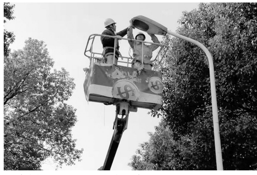
春节前夕,冬瓜山铜矿组织人员利用晴好天气,对狮子山南路和矿区区内路灯进行全面检查维护,及时更换损坏的灯泡,并对所有路灯灯罩进行清灰除尘,确保矿山节日安全。