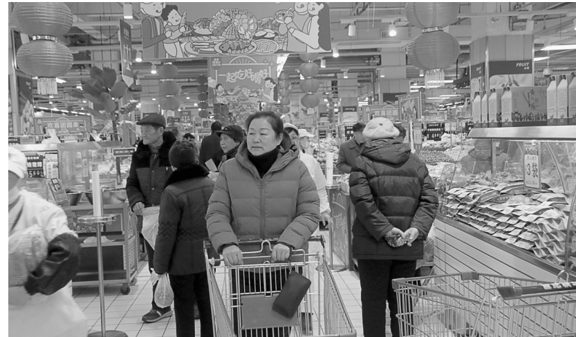
元月14日,离春节还有十天,但笔者在“世纪联华”超市里看到,前来采购年货的市民络绎不绝(如图)。据超市负责人介绍,连日来该超市从全国各地采购300多种年货可供市民选用。