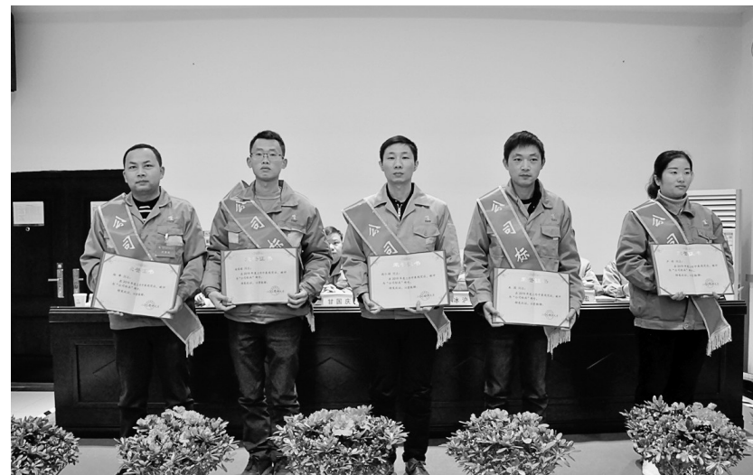
1月15日,铜冠铜箔公司对在2019年工作中取得显著成绩的先进集体和先进个人进行表彰奖励(如图),以此号召全体员工要学习先进人物,争先进、当先进,为实现2020年方针目标努力奋斗。