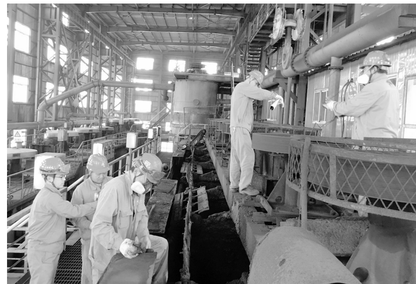
工程技术分公司加强设备维修动态管理、实时监控,要求项目管理员深入施工项目现场,对安全、质量、进度严格把关。图为11月9日,该公司金隆项目部项目管理员双休日时间仍然工作在金隆铜业稀贵课月修浮选机检修现场场景。