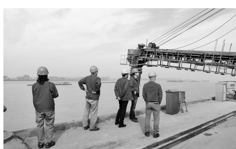
为进一步强化效能监察,11月3日以来,动力厂纪委组织商务、生产等单位相关人员前往长江岸边、码头及生产现场,对船运煤的来煤、过磅、取样、化验进行了现场督查。该厂坚持加强大宗原材料采购监督把关,确保了廉洁风险源点的有效防控。