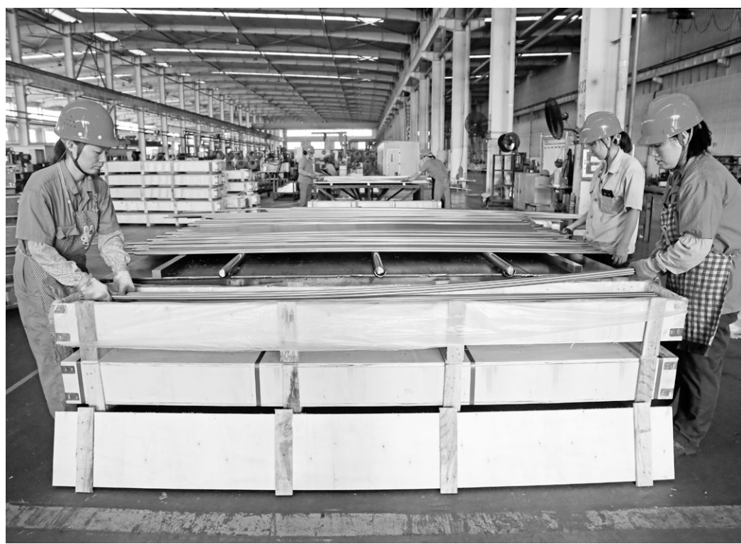
铜冠黄铜公司员工正在进行装箱作业。该公司从年初开始推进机台承包试点,目前拉拔各机台已实现全承包。通过承包试点,生产效率得到有效提升,员工收入得到有效保障,激发了员工工作积极性。特别是在人手不足的情况下,通过劳动效率提升,使车间生产在原来的三班调整为两班的情况下,仍然满足了生产和市场的需求。