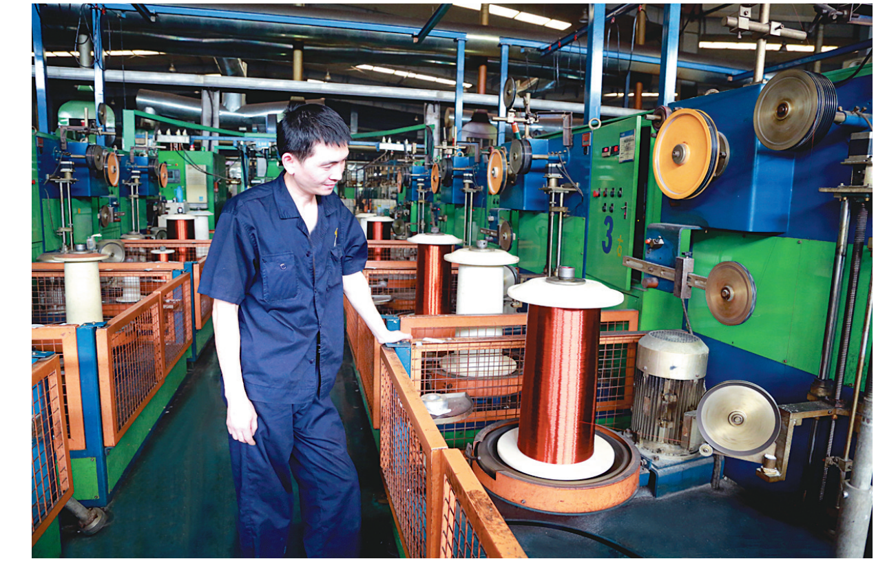
铜冠电工公司员工正在进行漆包线生产作业。今年以来,铜冠电工公司加大新产品研发力度,努力开拓新能源汽车用漆包线市场,取得了积极成效,目前已累计销售新能源汽车用漆包线产品600多吨,进一步提高了市场占有率。

本报讯 为加强国庆安全保卫及治安综合治理工作,日前,中科铜都公司立足企业自身情况,创造条件,落实措施,强化安全保卫及治安综合治理工作。