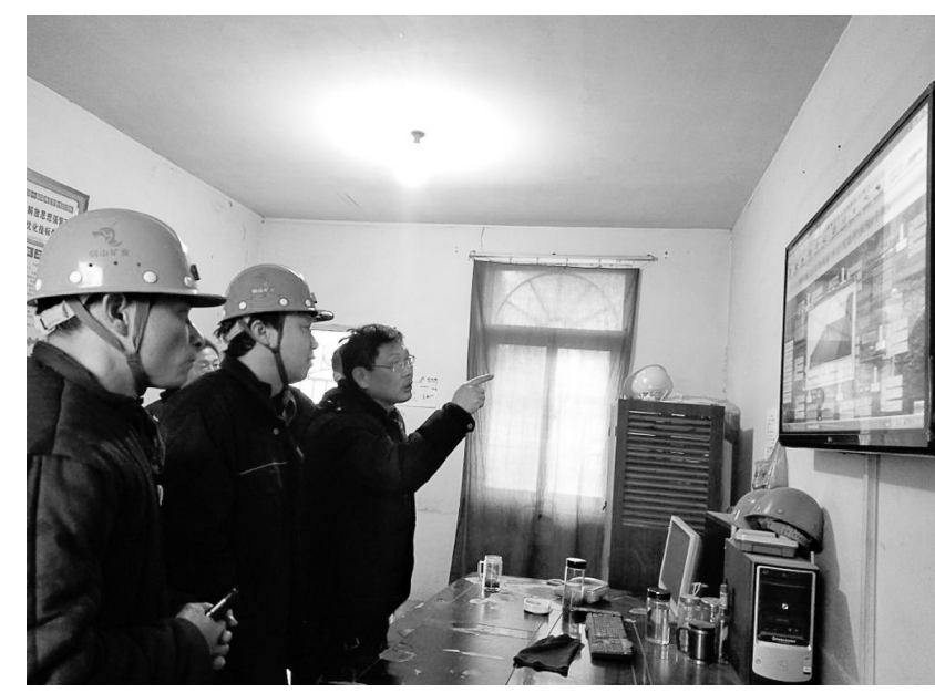
日前,铜山铜矿分公司开展章家谷尾矿库安全专项检查。该公司提前做好雨季防洪防汛工作,加大重点区域巡查,及时排除隐患,多措并举做好矿山安全生产工作。