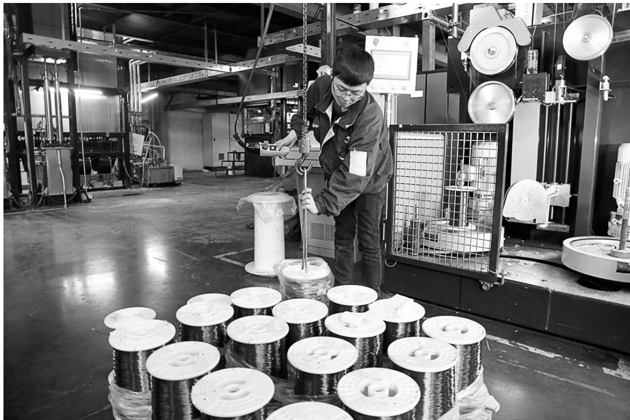
铜冠电公司漆包线分厂职工正在进行漆包线下线作业。铜冠电公司今年围绕“挖潜降耗”这个主题,持续开展精细化管理工作。在科学合理安排设备的开动时间,降低生产能耗指标,通过对现有老设备的升级改造提高设备生产效率,降低生产成本的同时,严格控制原材料进厂、生产、产品出厂的各个环节,减少废品损失。