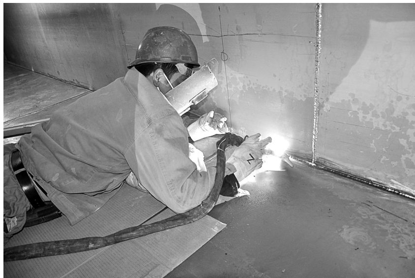
日前,铜冠铜箔公司三四工场对特种铜箔生产线进行停机检修。此次检修一方面为提升电子铜箔品质,对部分管道和设备进行升级改造;另一方面加强设备维护,对存在跑冒滴漏的槽罐和管道进行焊接。图为工人正在对槽罐进行漏焊。